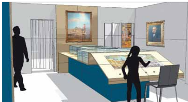
➤ Herinrichting de plate v1 belle époque