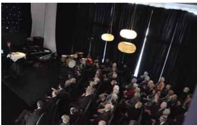
Vrienden tijdens de Algemene Vergadering op 25 feb. 2012

De reis naar Cambrai op 29 april bewees eens te meer hoe er tussen de deelnemende Vrienden een hechte en warme vriendschap kan ontstaan (zie sfeerverslag op p. ). Museumreizen en –bezoeken zijn een van de doelstellingen van de Vrienden Mu.ZEE, collectie stad Oostende, en onze reisleidster Sonja Geeraerts slaagt er telkens weer in om een boeiend programma samen te stellen. Ook de twee topmomenten van ontmoeting, de jaarlijkse Algemene Vergadering en de Garden Party na een geleid bezoek aan de Venetiaanse Gaanderijen, brengen de Vrienden nader tot elkaar in een gemeenschappelijke belangstelling voor kunst en cultuur rond het patrimonium van de stad Oostende.