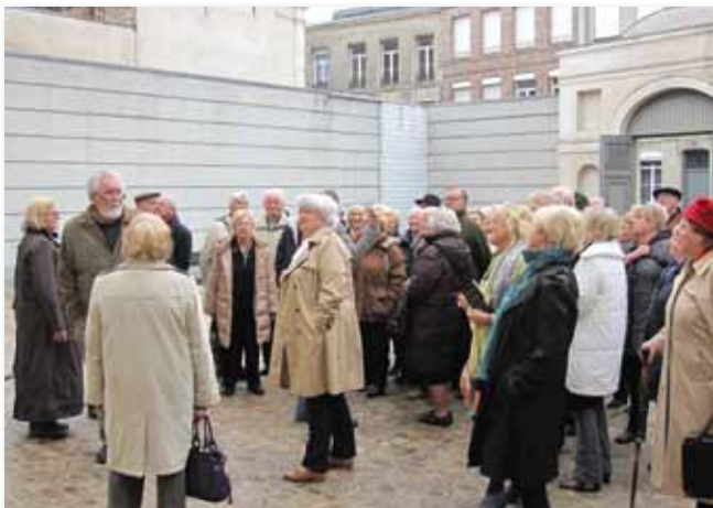
➤ Groep voor het Musée Municipal