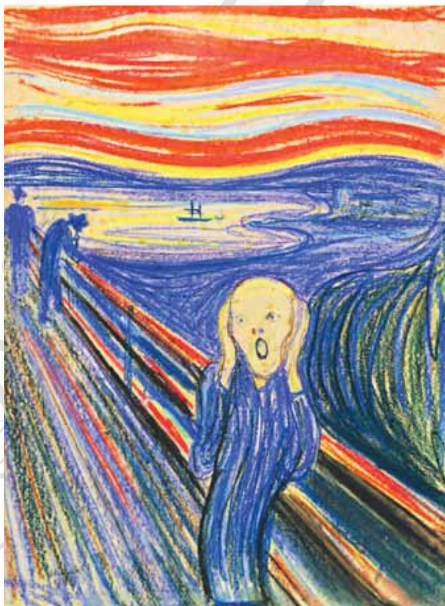
Edvard Munch, De schreeuw

Ik was aan het wandelen met twee vrienden. De zon ging onder. De hemel werd plots bloedrood. Ik voelde een zweem van melancholie. Ik hield de pas in en leunde uitgeput tegen de reling. Over fjord en stad, in somber blauw, strekten zich bloed uit en tongen van vuur. Mijn vrienden liepen verder. Ik trilde van angst en voelde hoe een lange, eindeloze schreeuw door de natuur trok.