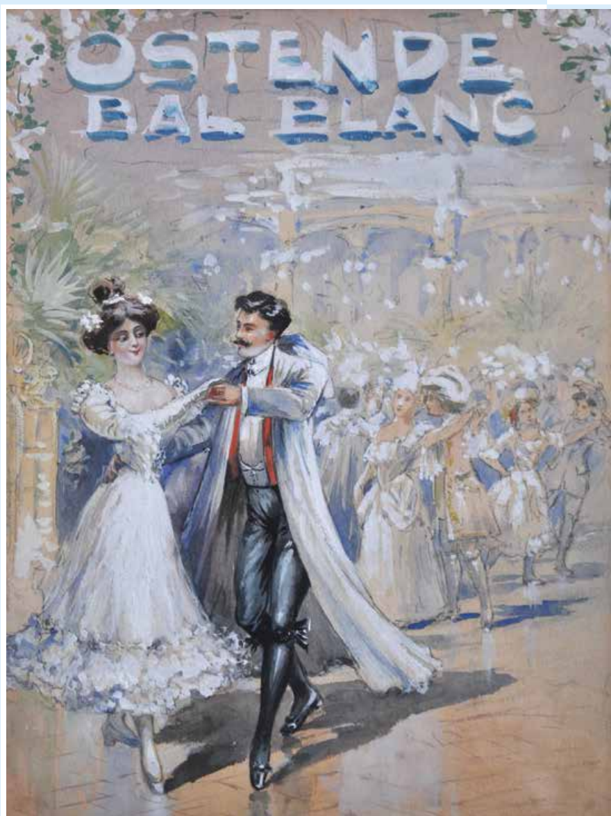
Emile Bulcke Affiche 'Ostende Bal Blanc', collectie De Plate, Inventarisnummer 2017/0762, 70 x 50 cm

jaargang 18 | Driemaandelijks tijdschrift | juli - augustus - september 2017 Identificatienummer: P006345