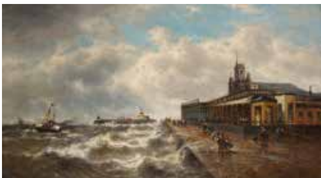
↳ François-Etienne Musin, 'Haven en Zeedijk van Oostende'

In 1865 liet hij het paviljoen drastisch vergroten en ombouwen tot een hotel. Hij verkocht het in 1877. Op deze plaats werd later het hotel Splendid opgetrokken.