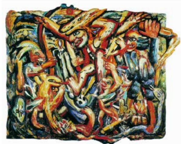
Fred Bervoets, 'De dood van een krijger', 1982

Zijn werken zijn een rechtstreekse weerspiegeling van zijn sociale bewogenheid. De kernidee die de grondlaag vormt van elk werk, is meestal een anekdotisch feit van autobiografische aard. Bervoets ziet zichzelf als een verteller, een prentmaker. Hij komt haast altijd zelf in zijn werk voor, soms als cowboy.