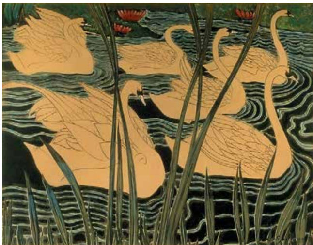
↳ Léon Spilliaert, 'Zwanen', 1904