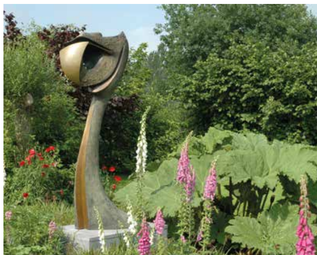
➤ Beeldentuin Mia Moreaux: 'Liberation of the spirit'

Openingstijden: zaterdag, zondag, maandag (en ook dinsdag 15 augustus) tussen 14 en 18.30 uur. Locatie: Eernegemsesteenweg 120, 8460 Oudenburg (Westkerke). Zie ook: miamoreaux.com