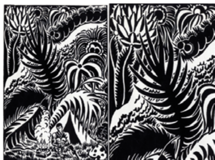
Frans Masereel, 'Melancholie', houtsnede, 1924