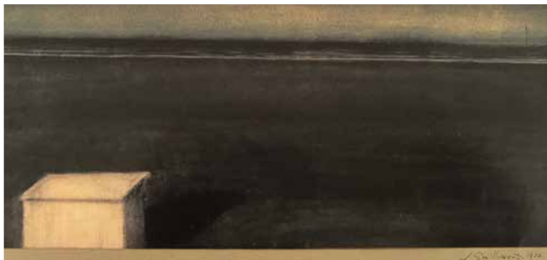
➤ Léon Spilliaert, 'Strandcabine', 1902

Wat de dijk- en strandperspectieven betreft, richt Spilliaert zijn blik op het oneindige perspectief van de zuilengalerij