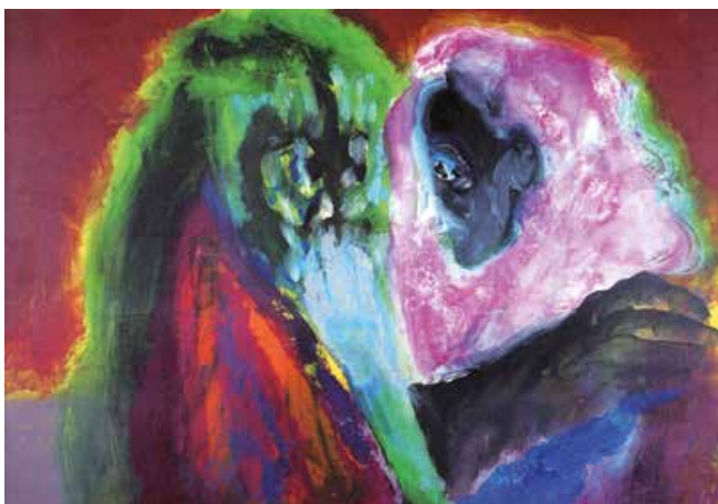
↳ Jan Cox, 'Hector en Andromache', Antwerpen 1975