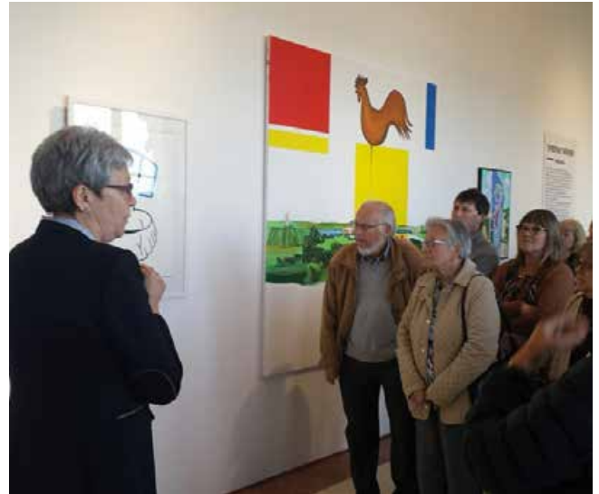
▶ De Vrienden voor het werk 'MondriHaan', een ludieke titel die voor zich spreekt.