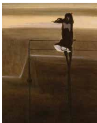
➤ Léon Spilliaert, 'De windstoot', 1904

Vanaf eind juni 2017 kan je via de digitale wandeling 'Léon Spilliaert' kennismaken met alle facetten van de schilder Spilliaert, zijn leven en zijn relaties met andere kunstenaars als Permeke en Ensor. Deze digitale wandeling voert je in de rusteloze voetsporen van de kunstenaar. Onderweg ontdek je het Oostende dat de kunstenaar inspireerde voor zijn beste werken. Spilliaert legde ironisch het potsierlijke schouwspel van baadsters in hun lachwekkende zwempakken vast en liet tegelijk de vrije loop aan zijn verbeelding. Vreemde kleureffecten bij vervagend licht en glanzende reflecties van kunstlicht op natte straten zijn terugkerende thema's in zijn werk.