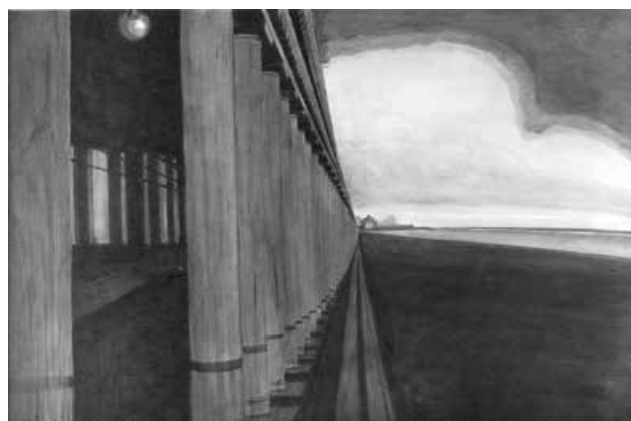
➤ Léon Spilliaert, 'De Koninklijke Galerijen van Oostende', 1908

Ook de digitale wandeling 'Op zeebenen door Oostende', die je door het maritieme verleden van de stad voert, kan je volgen met de mobiele app Questl. Meer informatie vind je op www.oostende.be/erfgoedroutes .