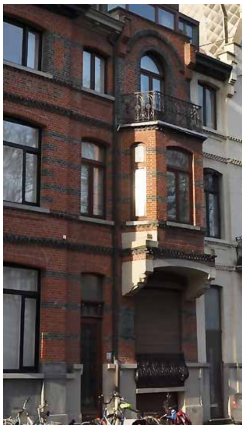
Woonhuis Emile Bulcke

Op de hoek van de huidige Spilliaertstraat (tot 1953 de Sint-Petersburgstraat) bevindt zich tegenover het Leopoldpark (in Oostende 'De Hof' genoemd) een roodbakstenen huis, met in de gevel een bronzen