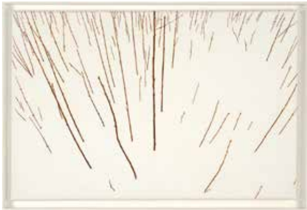
Werner Watty, '... soms sneeuwt het op 27 mrt', olieverf op linnen, 2015