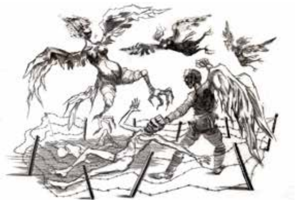
↘ Raoul Servais, 'The Angels of Death', ets, 2009

Raoul Servais (1 mei 1928, Oostende) is een gerenommeerde animatiefilmmaker. Begin jaren vijftig volgde hij een opleiding in de toegepaste kunsten aan de Koninklijke Academie voor Schone Kunsten in Gent (KASK). Servais schilderde en tekende, was ook grafisch heel actief, maar zijn hart lag van meet af aan bij de tekenfilm. De kunstenaar had ervaring noch financiële middelen, maar zijn nieuwsgierigheid en