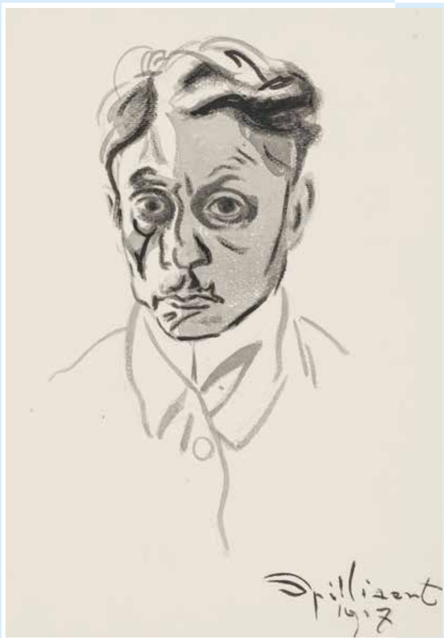
↳ Léon Spilliaert, 'Zelfportret', gewassen Oost-Indische inkt, 1917 34,6 x 25,8 cm, KBR inv. SV 72832

jaargang 19 | Driemaandelijks tijdschrift | juli - augustus - september 2018 Identificatienummer: P006345