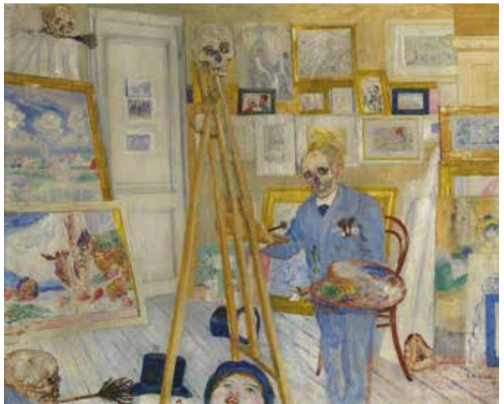
↘ James Ensor, 'Het schilderende geraamte', 1896, olie op doek