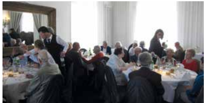
Degustatiemenu in de Venetiaanse Gaanderijen

Niet alleen Ensor krijgt dit jaar een eerbetoon. Ook zijn kunstkompaan en vleugelgenoot in Mu.ZEE, Léon Spilliaert, wordt geëerd met een zomerexpo in de Venetiaanse Gaanderijen. Velen zijn vertrouwd met zijn schilderijen en aquarellen, maar zijn prenten en tekeningen zijn bij het grote