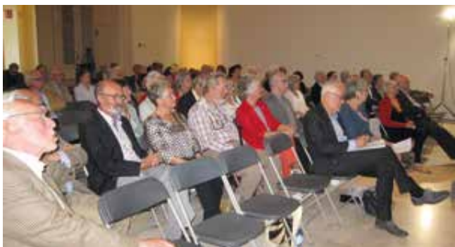
Bestuur en Vrienden op de algemene vergadering, © Paul Stevens

In het Ensorhuis zelf keert de rust terug. Originele werken van James zullen er weer worden opgehangen, afgewisseld met thematentoonstellingen van hedendaagse kunstenaars die een link hebben met Ensor. In de scenografie zal de nadruk gelegd worden op de gelaagdheid voor de verschillende doelgroepen: de individuele bezoeker, scholen, de meerwaardezoeker en families met kinderen.