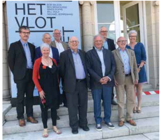
➤ Het nieuwe bestuur Vrienden Mu.ZEE, © Miche Boydens