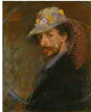
↳ James Ensor, 'Zelfportret met bloemenhoed', 1883-1888