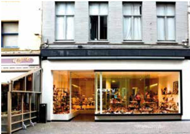
Locatie van de voormalige boekhandel Corman