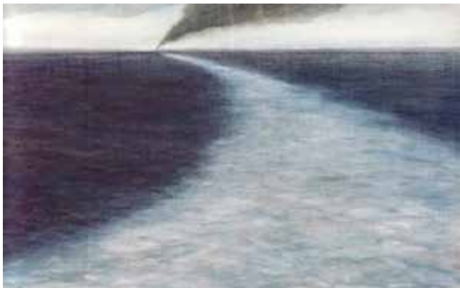
↳ Léon Spilliaert, 'Marine met kielzog', 1902

“De Vlaamse zee biedt mij haar paarlemoer, haar glinstering aan 's morgens, 's middags en 's avonds kus ik haar langdurig. O de weldoende kussen aan de geliefde zee, gelouterde kussen van zand, geurend naar schuim en aangewakkerd door wrangheid.” Die fascinatie mondt hier uit in een grootse modernistische daad. Het is een revolutionaire daad van verzet, tegen de traditionele “modderige holbewoners van de schilderkunst die het goddelijke aanschijn van de zee durven te bevuilden en bevleken”. Ensors zee is een diafane explosie van kleur en licht, een lyrische expressie die breekt met het realisme van zijn tijdgenoten.