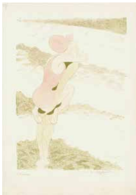
↳ Léon Spilliaert, 'De Baders', lithografie in olijfgroen, gehoogd met aquarel, 1917, 45 x 32 cm, KBR inv. S III 42241

Ook deze zomer nodigen wij u graag uit voor de traditionele Garden Party die vooraf wordt gegaan door een geleid bezoek aan de zomertentoonstelling in de Venetiaanse Gaanderijen. We verdiepen ons in de leefwereld van Léon Spilliaert aan de hand van zijn prenten en tekeningen. De Garden Party vindt plaats op donderdag 5 juli om 19 uur. Inschrijven bij Martine Meire (martine.meire@oostende.be of 059/25.88.00).