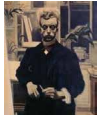
↳ Léon Spilliaert, 'Zelfportret met potlood', 1907-1908

Als naast de voortdurende behoefte om tegen de traditie aan te schoppen, de neiging om hoogst individueel de demonen van het eigen ik te peilen het tweede grote kenmerk is van het modernisme, dan is Ensor beslist een modernist. Dat peilen van het ik, het onbarmhartig aan de oppervlakte brengen van het onderbewuste, van de hilarische, frivole en duistere kantjes van de eigen persoonlijkheid zie je bij Ensor in de vele zelfportretten. Heel opvallend bijvoorbeeld in dit grote geestige, dubbelzinnige Zelfportret met bloemenhoed dat hij zijn hele leven heeft bijgehouden en dat hij in twee fasen heeft 'voltooid'. Hij is er afgebeeld als een pastiche op het bekende zelfportret van Rubens, maar als een echte modernist neemt hij er het sérieux van weg door zichzelf een kleurige bloemenhoed met afhappende pluim op te zetten, waardoor zijn ware aard het traditionele publiekspportret doorbreekt. Wat hij met dit portret vertelt is – in zijn eigen woorden – la belle légende du Moi, du Moi universel, du Moi unique.