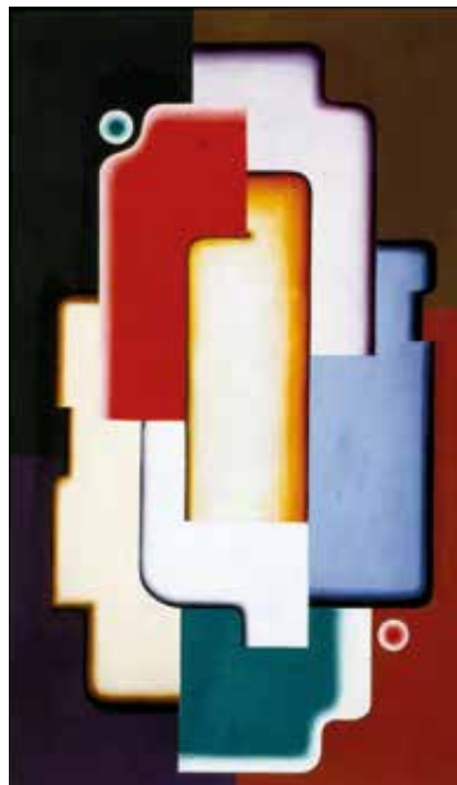
Pierre-Louis Flouquet, 'Constructie 34'

Léonard, Flouquet en Kassak deelden de overtuiging dat de productie van kunst een maatschappelijke rol te vervullen had. Hun werk als graficus, typograaf en ontwerper beantwoordde ongetwijfeld aan dit geloof in een 'nuttige' kunst, waarin schilder- en tekenkunst, architectuur, grafische en toegepaste kunsten dezelfde doelen dienden.