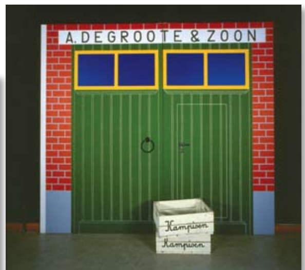
↳ Joseph Willaert Pakhuis A. Degroote & Zoon, 1968 INV 1969/99 Olieverf op doek; 250x280 cm collectie stad Oostende