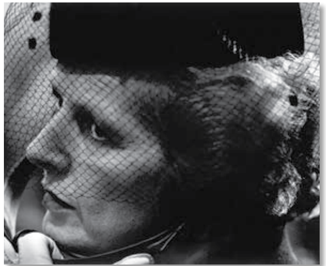
▶ 'Van onze fotograaf ter plaatse - 25 jaar persfotografie in De Standaard'

De expo is gratis toegankelijk op donderdag, vrijdag, zaterdag en zondag van 14 tot 17 uur, op zondag ook van 10 tot 12 uur. Tijdens de paasvakantie is de tentoonstelling elke dag open.