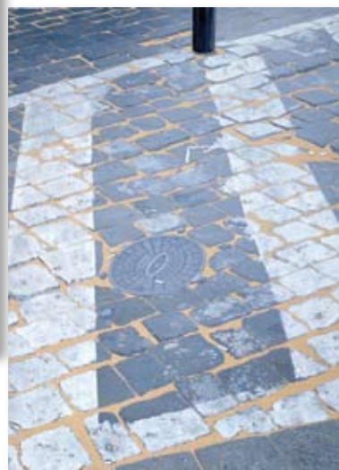
↳ Marcel Maeyer Zebepad met hydrant, 1972 INV K 552 Fotograaf : AD-Art, Sint-Amandsberg collectie provincie West-Vlaanderen