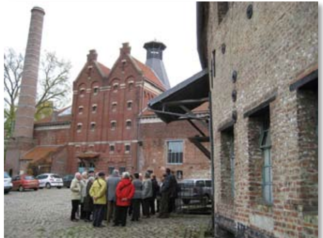
Reis Cateau-Cambrésis