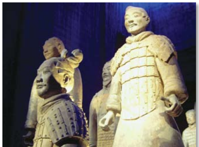
Reis maaseik