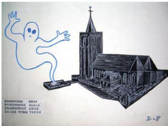
➤ De geest van Ensor met graf en kerk.

Ensor is niet meer. Zestig jaar geleden is hij gestorven, maar zijn erfenis blijft levend. Niet verwonderlijk als je de lange geschiedenis van zijn tachtig jaar leven op vele vlakken bekijken.