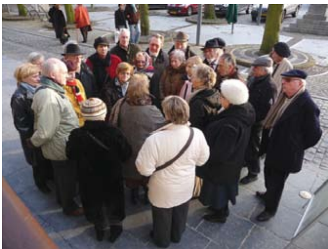
Reis maaseik

Bezoek tentoonstelling Emile Claus en het landleven. Emile Claus is één van de belangrijkste vertegenwoordigers van het Belgisch Impressionisme. De tentoonstelling brengt de beste werken van Emile Claus samen en belicht de centrale thema's in zijn werk: de landarbeider, het werk op het land, het dorpsleven, het leven met de rivier en het zuivere landschap. Zijn werk wordt geconfronteerd met Belgische tijdgenoten zoals Willy Finch, Leon Frédéric, Constant Permeke, Constant Meunier en Théo van Rijsselberghe. We bezoeken de tentoonstelling onder begeleiding van gidsen.