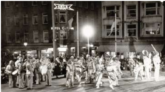
↘ Gilissen der zee