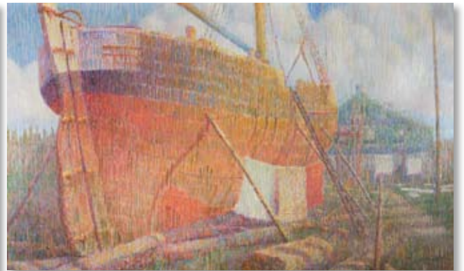
↘ Jan Declerck Scheepswerf Panesi