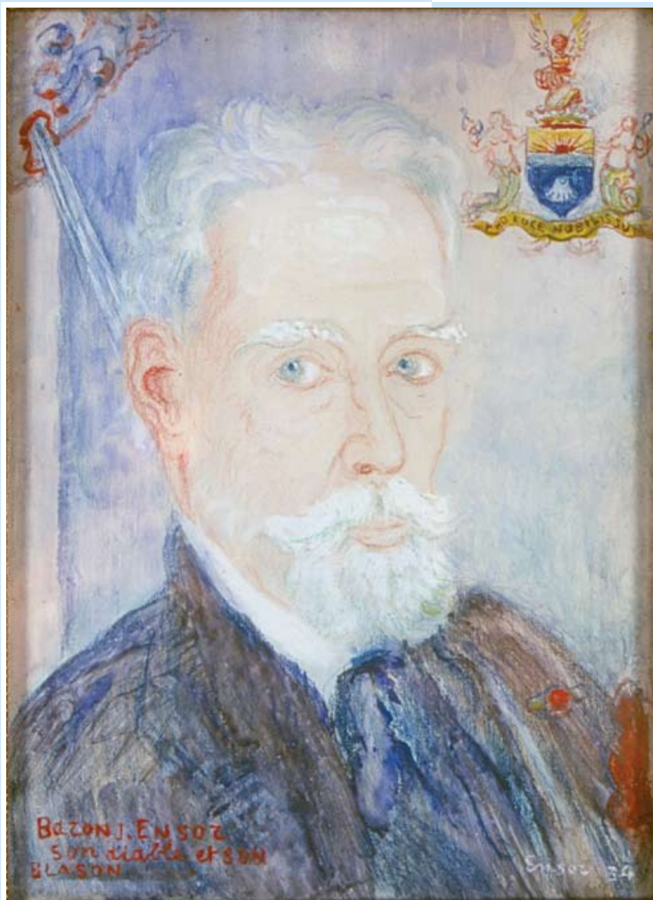
↳ Ensor, zijn duivel, zijn wapenschild, James Ensor INV 1999/2.207, olieverf en potlood op paneel, 21,5 x 16 cm Mu.ZEE, collectie stad Oostende