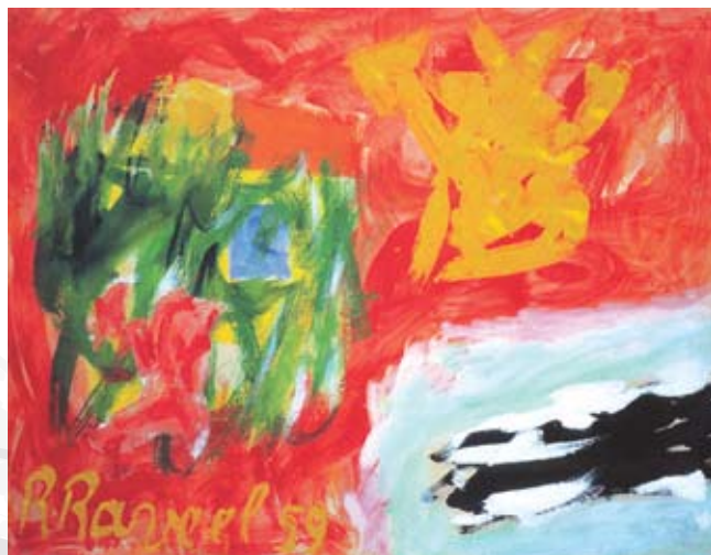
↳ Roger Raveel Een beetje blauw, geel en groen in een landschappelijk rood, met een wit-zwarte dreiging. 1959, olieverf op doek, 56 x 72 cm