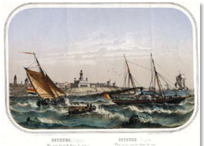
➤ De haven van Oostende

Van in de prehistorie vinden we sporen van een intensief scheepvaartverkeer tussen de Vlaamse kust en Kent met handelsdoeleinden. Het passagiersverkeer tussen Oostende en Dover kende een opmerkelijke bloei in de Belle Epoque. De haven van Oostende was ook van militair en strategisch belang voor de grote maritieme naties. Echter door de eeuwen heen bleef de lokale visserij ook een belangrijke troef voor deze haven.