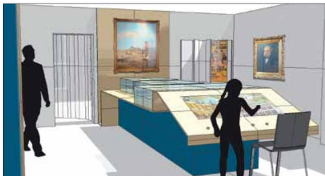
↘ Herinrichting de plate v1 belle époque