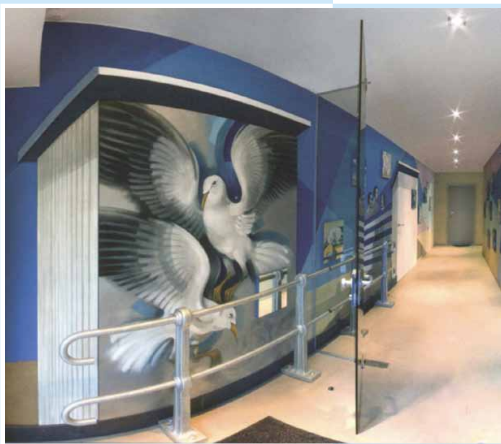
Willy Bosschem muurschildering, 2011

jaargang 12 | Driemaandelijks tijdschrift | oktober - november - december 2011 Identificatienummer: P006345