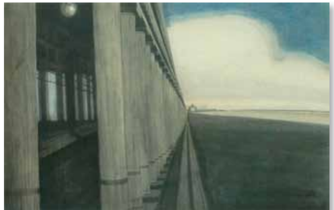
➤ Léon Spilliaert, Koninklijke Gaanderijen te Oostende (1908), Oost-Indische inkt op papier, 48x63cm.

gelmatig geschilderd: de Koninklijke Galerijen. Enkele van zijn beste werken hebben die mooie oude galerij tot onderwerp. Het verticale lijnenspel van de zuilen dat de diagonale lijnen van zee, strand en dijk doorbreekt, kon niet anders dan hem inspireren. De Galerijen zijn, hoe klassiek ook, een architectonisch wonder. Het wonderlijke ervan kan men niet van foto's aflezen, dat kan pas ten volle worden ontdekt wanneer men dit bouwwerk gebruikt, beleeft. (...) Wat de Koninklijke Galerijen zo fraai maakt, is de reeks dubbele zuilen (een negentigtal, heb ik eens geteld). Als je door de gaanderij loopt, onderbreekt en ritmeert de zuilenpartij al naargelang van je pas de blik die je op het strand en de zee werpt. De horizontale lijn van de kust wordt geregeld onderbroken door de verticale lijn van de zuilen. Dit stroboscopische effect is telkens anders, maar steeds heeft het iets magisch. Het horizontaal gecomponeerde beeld van dijk, strand en zee wordt geselementeerd en blijft toch één! (...)