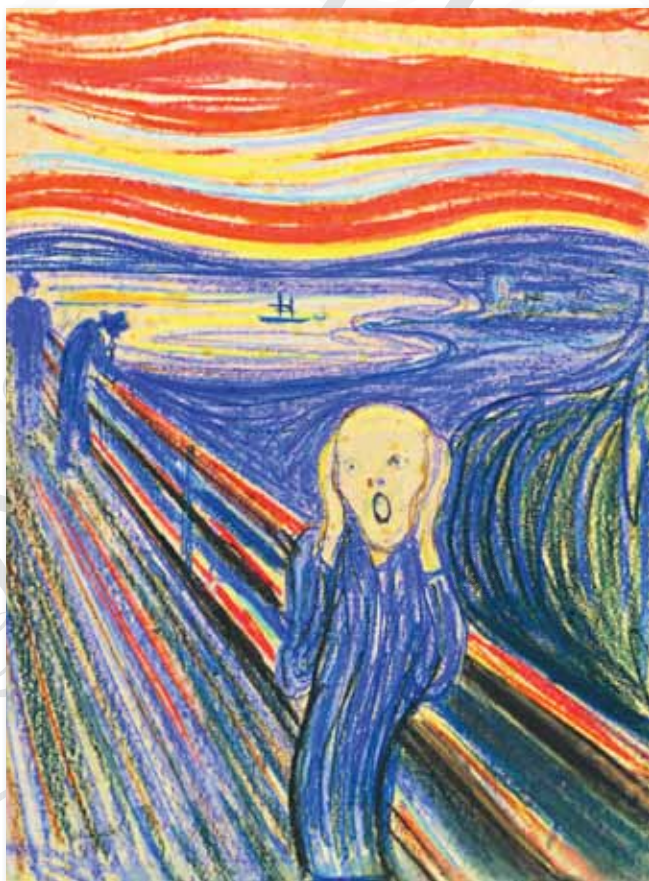
Edvard Munch, De schreeuw

Ik was aan het wandelen met twee vrienden. De zon ging onder. De hemel werd plots bloedrood. Ik voelde een zweem van melancholie. Ik hield de pas in en leunde uitgeput tegen de reling. Over fjord en stad, in somber blauw, strekten zich bloed uit en tongen van vuur. Mijn vrienden liepen verder. Ik trilde van angst en voelde hoe een lange, eindeloze schreeuw door de natuur trok.