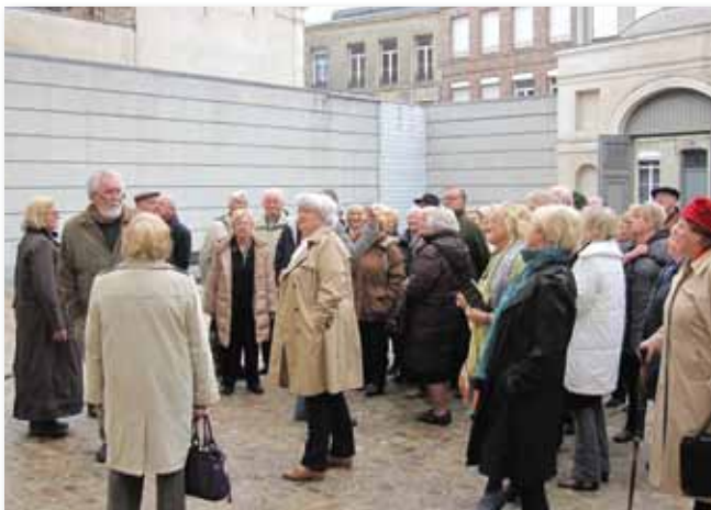
➤ Groep voor het Musée Municipal