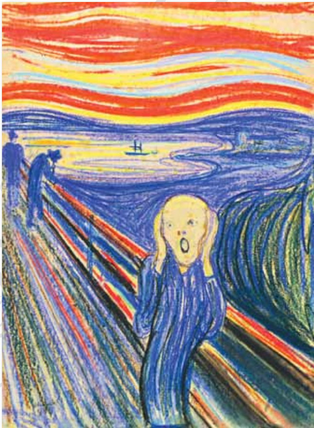
Edvard Munch, De schreeuw

Ik was aan het wandelen met twee vrienden. De zon ging onder. De hemel werd plots bloedrood. Ik voelde een zweem van melancholie. Ik hield de pas in en leunde uitgeput tegen de reling. Over fjord en stad, in somber blauw, strekten zich bloed uit en tongen van vuur. Mijn vrienden liepen verder. Ik trilde van angst en voelde hoe een lange, eindeloze schreeuw door de natuur trok.