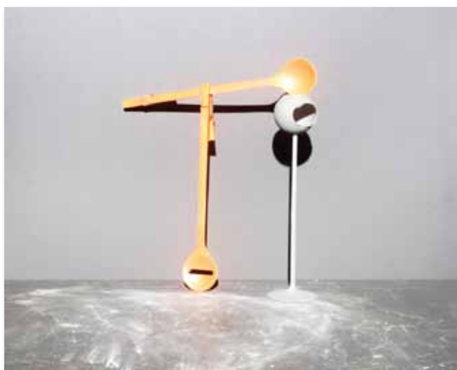
▣ © Jos de Gruyter & Harald Thys. Objekte als Freunde , 2010. Courtesy of the artists

De Belgische kunstenaars Jos de Gruyter (°Geel 1965) en Harald Thys (° Wilrijk 1966) zijn vanaf deze zomer te zien in Mu.ZEE met de tentoonstelling Objekte als Freunde .