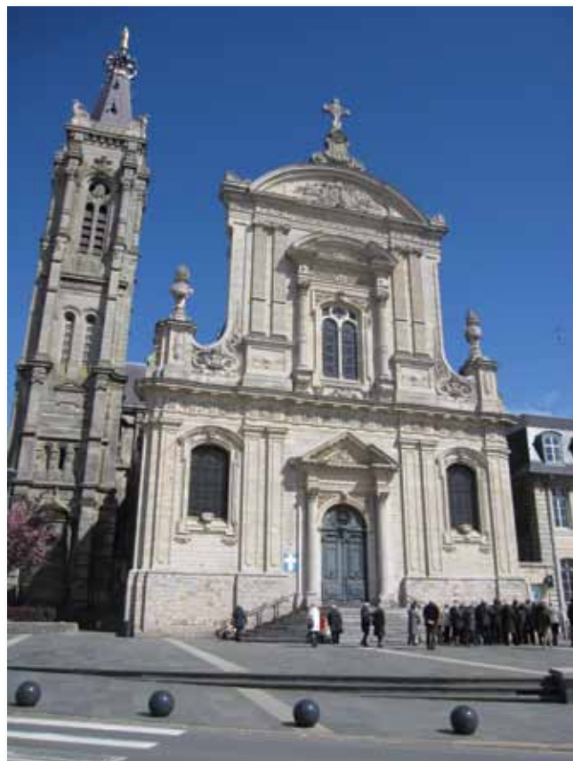
➤ Groep voor de kathedraal

De stadsrondrit was begonnen en eindigde bij het Toerismebureau, vlak tegenover de kathedraal die we te voet wilden bezoeken. We kwamen helaas niet verder dan de voorgevel, want het gebouw was en bleef op slot. Onze jonge, enthousiaste gids maakte er het beste van met uitleg over de afbeeldingen op de voorgevel en een vergelijking met de barokke jezuïetenkapel aan de overkant. Daarna keerden we terug naar het Toerismebureau om er de befaamde Bétises de Cambrai te proeven, een muntsnoepje dat door de fout van een bengel bij toeval ontstaan was. Voordat we de reizende tentoonstelling van het Centre Pompidou bezochten, met topwerken van Picasso, Braque, Léger en vele anderen, kregen we een Café Gourmand voorgeschoteld in wat op het eerste gezicht een onooglijke bar leek. Maar de koffie was goed en de appeltaart, slagroom en chocomousse erbij smaakten goed.