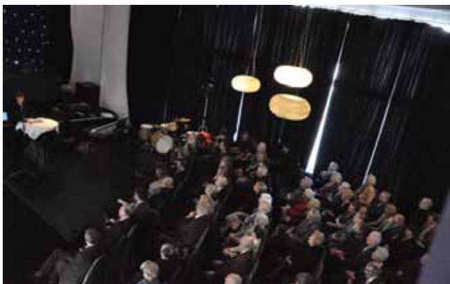
Vrienden tijdens de Algemene Vergadering op 25 feb. 2012