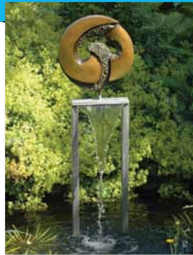
Mia Moreaux, Perpetuum (waterval)