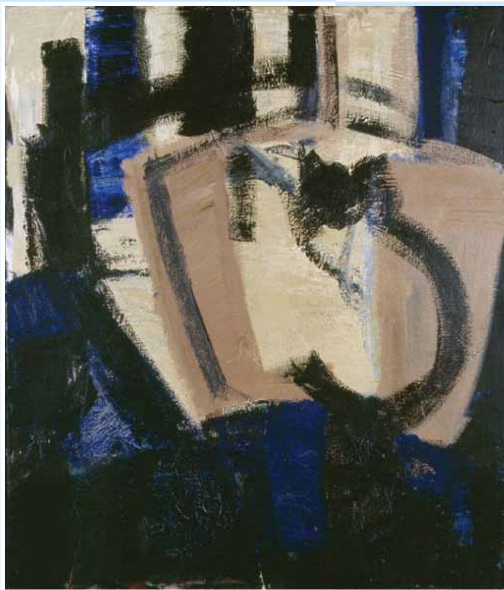
↳ Herman Bellaert, Atelier met kat (1986) Acryl op doek, 110 x 95 cm. © Stad Oostende