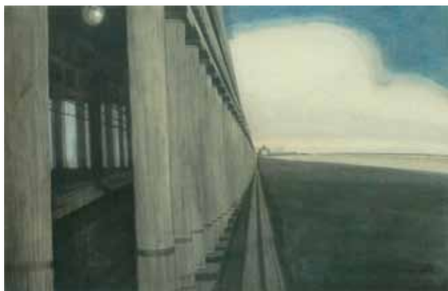
➤ Léon Spilliaert, Koninklijke Gaanderijen te Oostende (1908), Oost-Indische inkt op papier, 48x63cm.

gelmatig geschilderd: de Koninklijke Galerijen. Enkele van zijn beste werken hebben die mooie oude galerij tot onderwerp. Het verticale lijnenspel van de zuilen dat de diagonale lijnen van zee, strand en dijk doorbreekt, kon niet anders dan hem inspireren. De Galerijen zijn, hoe klassiek ook, een architectonisch wonder. Het wonderlijke ervan kan men niet van foto's aflezen, dat kan pas ten volle worden ontdekt wanneer men dit bouwwerk gebruikt, beleeft. (...) Wat de Koninklijke Galerijen zo fraai maakt, is de reeks dubbele zuilen (een negentigtal, heb ik eens geteld). Als je door de gaanderij loopt, onderbreekt en ritmeert de zuilenpartij al naargelang van je pas de blik die je op het strand en de zee werpt. De horizontale lijn van de kust wordt geregeld onderbroken door de verticale lijn van de zuilen. Dit stroboscopische effect is telkens anders, maar steeds heeft het iets magisch. Het horizontaal gecomponeerde beeld van dijk, strand en zee wordt gesegmenteerd en blijft toch één! (...)