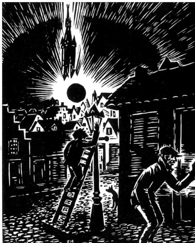
De lantarenopsteker, Frans Masereel, houtsnede

Verstomd heeft de klopper toegeluisterd, als stond hij ineens voor een tovenarij. ‘Ben jij dat nog, lantarenop-