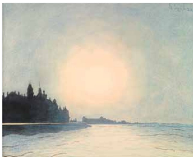
➤ Léon Spilliaert, La digue d' Oostende vue depuis l'estacade , ca. 1910

Spilliaerts landschappen zijn die van een wandelaar, niet die van een statische waarnemer die zijn ezel toevallig op een gezichtspunt heeft neergezet. Het zijn taferelen die vanuit een geduldige benadering, een langzame beweging ontstaan. Geen vluchtige beelden die de schilder-wandelaar in het voorbijgaan opvangt – Spilliaert is geen impressionist! Integendeel, ze zijn het resultaat van een gestage ontdekkingstocht. (...) Wat Spilliaert vooral – haast op magische wijze – heeft gevat, is het uitzonderlijke van de kustlijn of juist, haar perspectief. Hij schildert de zee doorgaans met een stuk van het strand en de dijk erbij. Deze drie elementen zoeken parallel aan elkaar een vluchtpunt. Dit is van een serene onverbiddelijkheid. De essentie van het ‘Oostende-gevoel’ is het perspectief dat naar niets leidt, tenzij naar een vluchtpunt in het oneindige. (...)