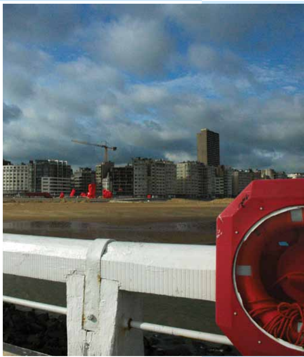
↳ Zicht op Zeeheldenplein

jaargang 13 | Driemaandelijks tijdschrift | oktober - november - december 2012 Identificatienummer: P006345