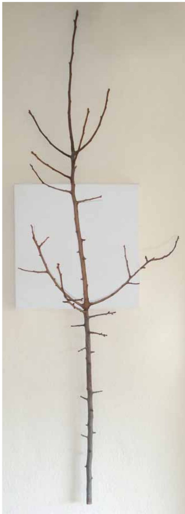
Olieverf op doek, 205 x 65 cm (doek 40 x 40)

‘Talent... talent moet groeien. Als kunstenaar blijf je trouwens voortdurend evolueren. Een werk is geen eindpunt maar een passage, en kunst wordt niet gemaakt. Is het een kwestie van kennis en kunde, van ervaring en kunde? Ik heb eind jaren zestig in avondschool aan de