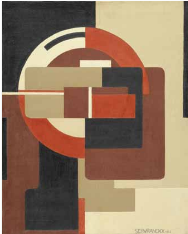
▣ Victor Servranckx, Opus 2 – 1922 (Rode rotatieve) Centre Pompidou, Press Photo Dist. RMN – GP /© Sabam Belgium 2012