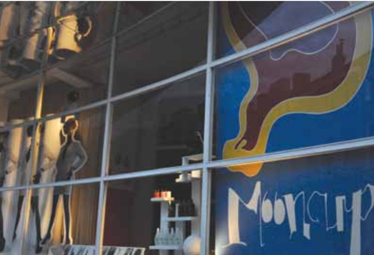
Foto voorgevel Mu.Zee

'Uit alles wat je doet, moet je passie voor kunst spreken!' Die woorden uit de mond van een conservator moeten idealiter als een vanzelfsprekendheid klinken. Het museum immers, en zeker Mu.ZEE, dient een belangrijke plek te zijn waar echte ontmoetingen kunnen plaatsvinden. Maar waar je ook voor verrassingen komt te staan. Tijdens de tocht van het ene kunstwerk naar het andere maakt de kijker voortdurend keuzes, maar dat actieve fenomeen wordt ons vergemakkelijkt als de