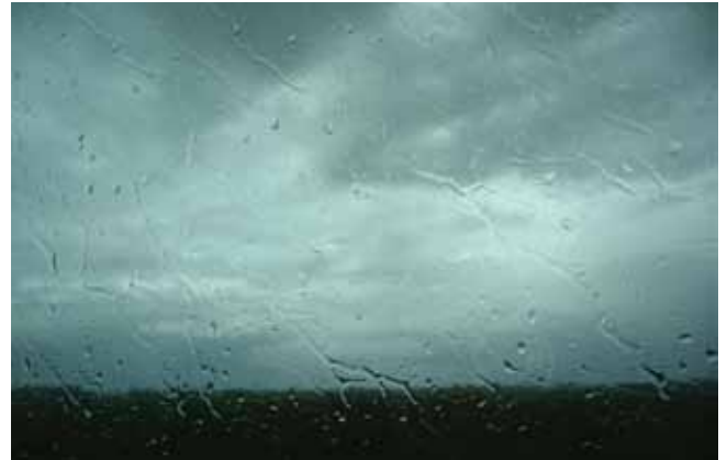
Buiten woedt, binnen goed