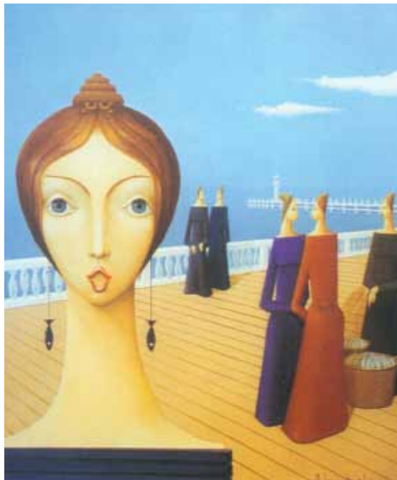
↳ 'Zeedijkwandeling', olie, 0,50 x 0,60 cm, 1984

Zeer karakteristiek in het oeuvre van Gust Michiels is de aanwezigheid van keramiek. Hierin vertoont hij een opmerkelijke voorliefde voor die materie die zo glad, glazig en gevoelig kan zijn. Het is een materie die overkomt als een soort streling. Zij nodigt als het ware uit om de