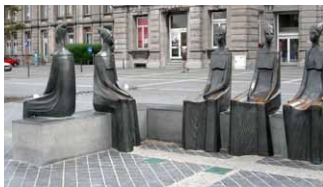
➤ 'Ode aan de vissersvrouwen' (vijf beelden in brons: 2m hoog x 3m x 6m), 1998

Het oeuvre van Gust Michiels staat inderdaad in het teken van de vrouw, de vissersvrouw in het bijzonder, en van de zee en alles wat erin leeft. Die vrouwen geeft hij sterk verfijnd weer, wat met zich meebrengt dat ze tot een soort archetype zijn uitgegroeid. Meer nog, tot symbolen. Meteen creëert hij in zijn oeuvre ook een surrealistische sfeer en vervreemding. De wijze waarop Gust Michiels vorm geeft aan zijn figuren, maakt zijn oeuvre onmiddellijk herkenbaar. Het betreft kenmerken die men in al zijn tekeningen, schilderijen, keramiek en beeldhouwwerken terugvindt. Het kapsel van de vrouwenfiguren vormt een eenheid met de specifieke trekken van het gelaat, waarin de ogen, de oogleden, de wenkbrauwen, de neus en de lippen één elegant geheel vormen. Over de verschijning van de vrouwen in het werk van Gust Michiels schreef de kunstcriticus Jan Guillemin in 1984: "Zijn vrouwen zijn meestal gestileerd, hij toont ze meestal langgerokt en het zijn verschijningen die wel een beetje de wereld van Paul Delvaux oproepen. En in zijn grafisch oeuvre neemt Michiels zijn toevlucht tot helle, opvallende kleuren die transparant het best overkomen."