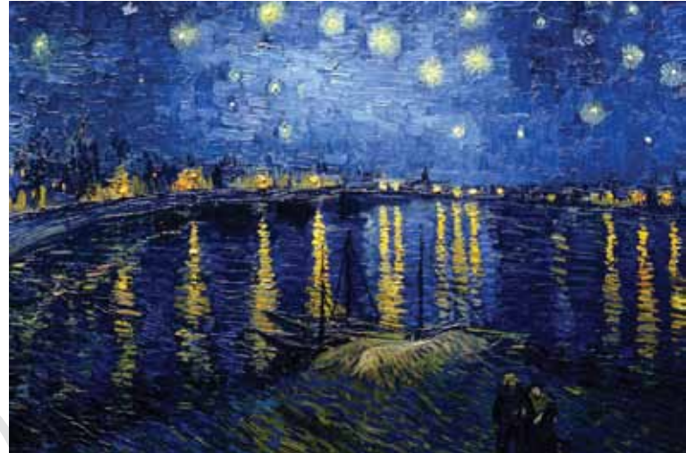
Vincent van Gogh - 'Sterrennacht boven de Rhône', Arles (sept. 1888) olieverf op linnen - 72,5 x 92 cm

En ik, nietig wezen, van de grote sterrende leegte dronken, ik naar gelijkenis en beeld van het mysterie, voelde mij zuiver deel van de afgrond en ik wentelde mee met de sterren en mijn hart sloeg op drift in de wind.