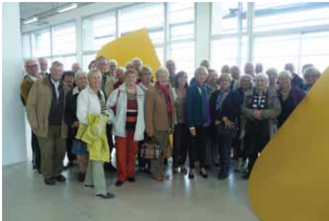
De Vrienden in het FRAC

Op zaterdag 24 mei 2014 trokken de Vrienden in de voormiddag naar het Musée de Flandre in Cassel voor een bezoek aan de vaste collectie en de tentoonstelling Erasmus Quellinus II.