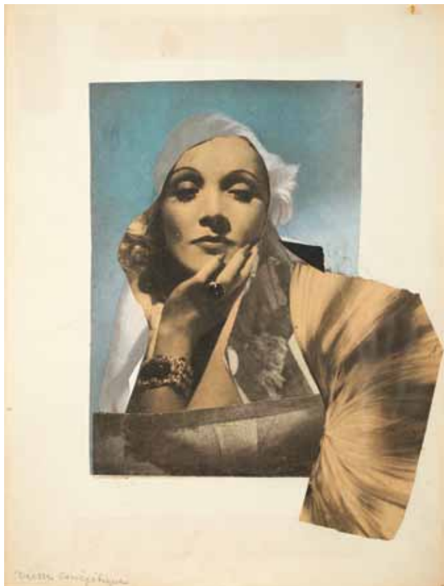
Paul Joostens, La déesse cinématographique. Mu.ZEE Oostende © Paul Joostens

Episode II: Collages & Assemblages: 28 juni - 14 september 2014