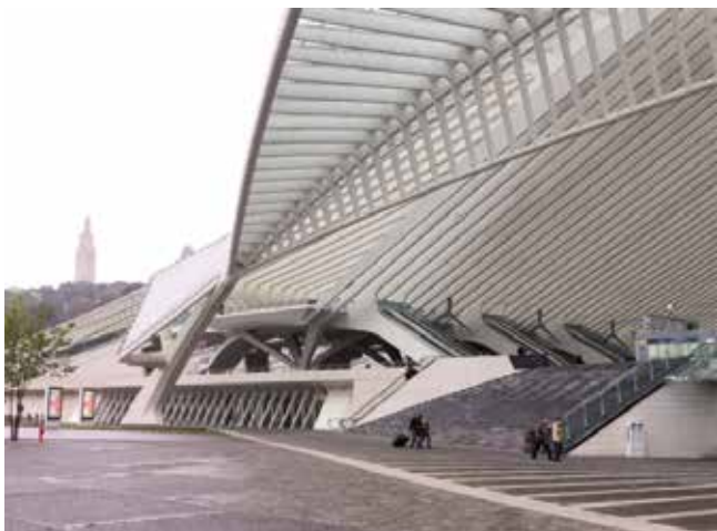
➤ Ingang station Luik-Guillemins