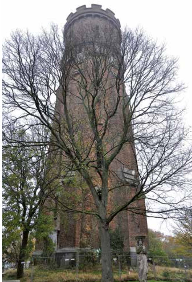
➤ De oude watertoren

Op een heldere dag ontdekt een kunstzinnig oog (en alle Vrienden van Mu.ZEE bezitten er zo'n paar) in de skyline van Oostende het laatste kroontje van wijlen de Koningin der Badsteden: de krans kantelen boven op onze oude watertoren. In de Belle Époque diende deze eenzame reus heel prozaïsch als drukregelbaar voor het drinkwater. Maar de ingenieur-ontwerper beschikte gelukkig over een artistieke ziel en wilde zijn 'ouvrage d'art' ook aantrekkelijk doen overkomen als een burgerlijke tegenhanger tussen de spitse kerktorens. Daarin slaagde de onbekende ambtenaar van de Société de Distribution d' Eau met vrucht, zodat we heden onze 'oude watertoren' als een kunstwerk mogen koesteren. De massieve en vele tonnen zware waterkuip bovenaan gaf hij een gladde buitenhuid en ze lijkt er lichter door. Volgens de toen geldende opvattingen over esthetiek mag zo'n massa niet brutaal afgesneden liggen als de broekspijp van een jeanspak, maar eist ze een 'beëindiging'. De ontwerper tekende er dus die transen op, daarmee verwijzend naar een middeleeuwse vestingtoren, een symboliek die samenhang met stedelijke zelfstandigheid. Voor ons komt zo'n versiering ouderwets-sentimenteel over, maar ze blijft bescheiden en hindert ons gevoel niet. De steunberen