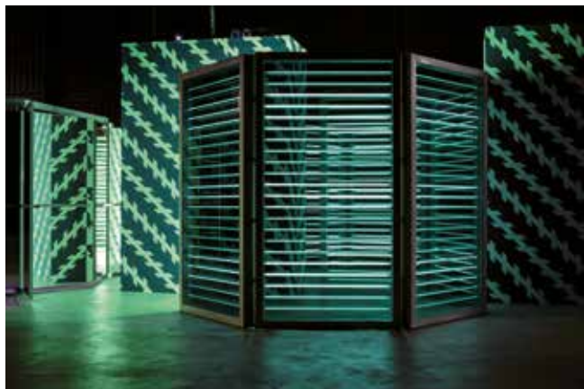
Carsten Höller, Double Neon Elevator, 2016

Carsten Höller. Videoretrospective with Two Lightmachines is het eerste grote overzicht van het audiovisueel werk van deze kunstenaar. Sinds begin 1990 maakt Carsten Höller experimentele en vaak monumentale installaties. In 1993 zette hij een punt achter zijn carrière als agrarisch entomoloog en werd hij kunstenaar, maar bleef wel geïnteresseerd in het gedrag van insecten en andere levende organismen. Zijn audiovisueel werk focust zich dan