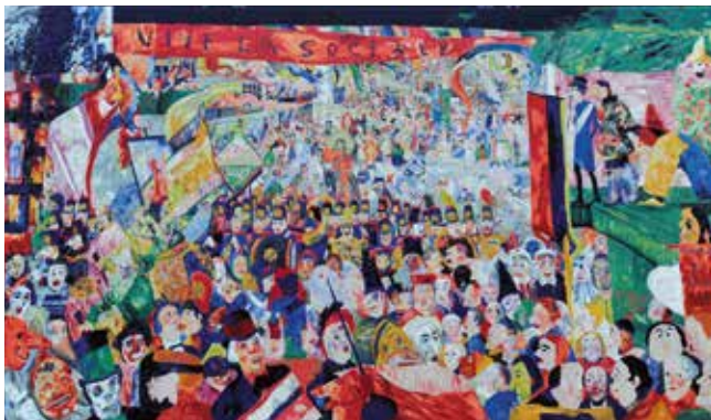
Wandtapijt James Ensor 'De blijde intrede van Christus in Brussel' © Daniël De Kievith

De Stad Oostende heeft de grootste collectie Spilliaert in de wereld. De bescheiden schilderijencollectie van Ensor in Mu.ZEE kunnen we aanvullen met unieke archiefdocumenten en het vrijwel volledige grafische oeuvre. Twee uitvergroete en muurvullende foto's van