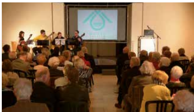
Algemene Vergadering 2016

De leden van de raad van bestuur worden door de algemene vergadering, bij meerderheid van stemmen van de aanwezige leden, aangesteld voor een termijn van zes jaar. Om de drie jaar wordt de helft van de leden van de raad van bestuur vernieuwd. (...) Uittredende leden zijn herkiesbaar.