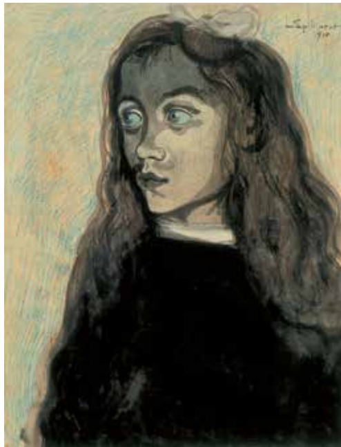
↳ Vissersmeisje, 1910, Léon Spilliaert

Léon Spilliaert (1881-1946) begon op achttienjarige leeftijd te schilderen, rond 1900, toen Oostende op een hoogtepunt van internationale bloei was als badstad. Maar dat raakte Spilliaert niet. De stedeling zegde hem niet veel; hij stond dicht bij de natuur: de verlaten dijk, de kille zolder, de eenzame dokken... Als hij dan toch een personage schilderde, was het aangezicht hol, vol schaduw, vergroeid en afgeleefd.