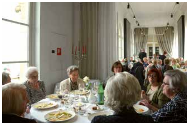
Vrienden aan tafel in de Venetiaanse Gaanderijen

€ 50 p.p. • voor 24 februari 2017 over te schrijven op rekening BE16 0012 0908 3374 p.a. Albatrosstraat 10, 8400 Oostende met de vermelding 'degustatiemenu AV 04/03' N.B. Het aantal beschikbare plaatsen is beperkt tot 60 personen Begin februari 2017 ontvangt u een individuele uitnodiging via de post, met alle verdere details.