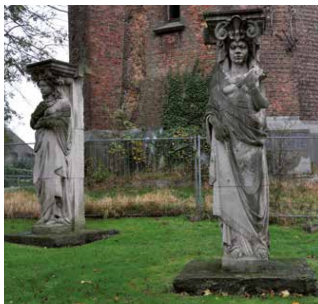
➤ De kariatiden

onder dit zware reservoir mochten zich daarentegen krachtig opdringen en daarin slaagde de ontwerper eerlijk en evenwichtig. Ook de smalle raampjes tussenin versterken de indruk van soliditeit door de verhoudingen van hun maten. De oude watertoren behoort aldus tot het erfgoed van de eens beroemde badstad en verdient een gepaste onderhoudsbeurt. Mettertijd eiste de moderne hoogbouw een steeds krachtiger waterdruk en kwam onze sympathieke 'château d'eau' in ademnood. Daarom overheerst nu een jongere en opgeschoten broer het park. Hij omvat echter niet meer dan een mager betonskelet in een wijde baksteenmantel, met op halve hoogte een insnoering als de valse taille bij een aanstellerige madam. Maar nergens benadert hij de spontane zwier van een koeltoren bij een kerncentrale.