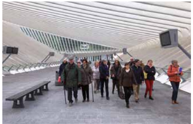
➤ De Vrienden met gids in het station

De lunch was in de nabijgelegen Brasserie de l'Univers, met een typisch Luiks menu: boudin de Liège in een coulis met scampi, boulets à la liégeoise met frietjes en sla en bij de koffie een appeltaartje met vanille-ijs en slagroom.