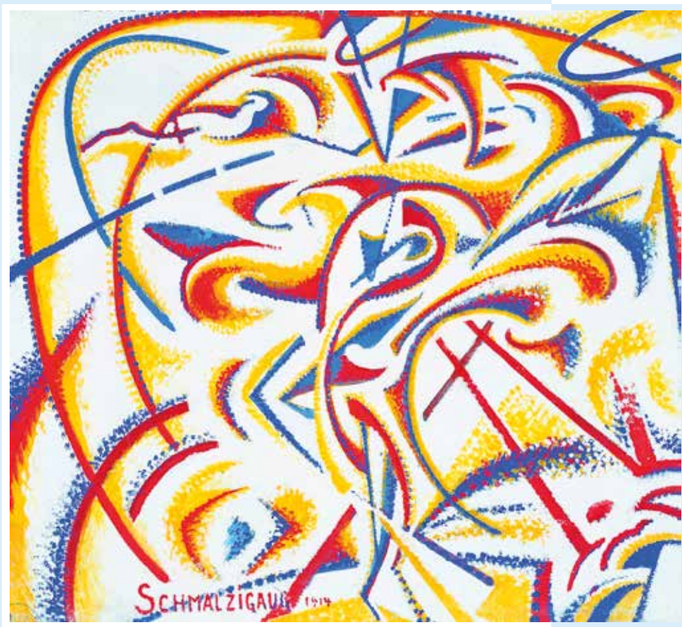
↳ Jules Schmalzigaug, Dynamische beweging van een danseres, 1914 © Jules Schmalzigaug en Mu.ZEE Oostende. Foto: Steven Decroos

jaargang 18 | Driemaandelijks tijdschrift | januari - februari - maart 2017