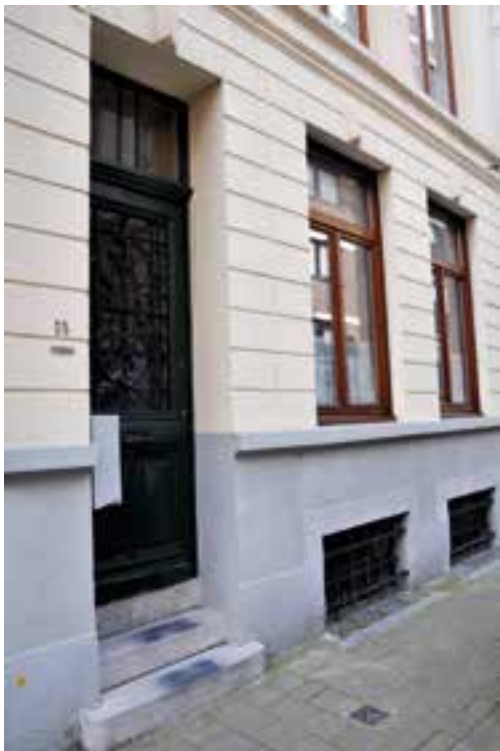
Woonhuis Maurice Antony