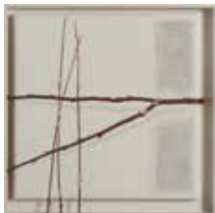
➤ Werner Watty, 'Silent voices 5.', olieverf op linnen, 34 x 34 cm'

Van 1 oktober 2017 tot eind maart 2018 exposeert Werner Watty bij Galerie/restaurant Imperial, Leopold I Esplanade 9, De Panne. Opening op 1 oktober om 11 uur door Hugo Brutin. Dagelijks van 11-19u. Gesloten op woensdag en donderdag.