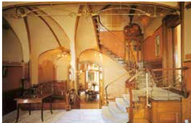
➤ Interieur Hortamuseum