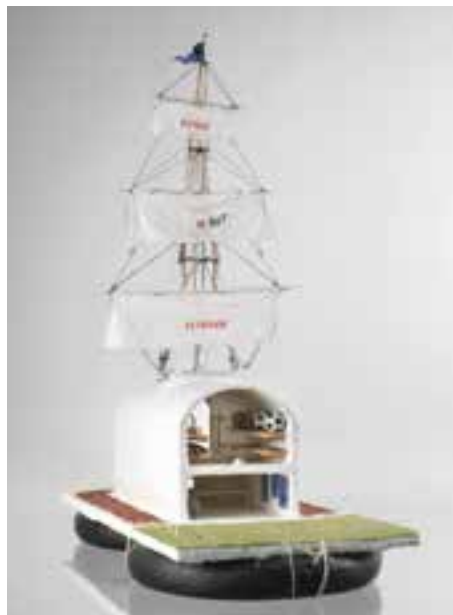
➤ Jan Fabre, 'Kunst is (niet) eenzaam', 1986, © Lieven Herreman

Dit najaar loopt in Oostende de tentoonstelling 'Het Vlot. Kunst is (niet) eenzaam', de opvolger van 'De Zee', deze keer samengesteld door Jan Fabre. Aan de basis liggen enkele puur menselijke onderwerpen: het eenzame pad, de drang om te overleven, het verlangen naar verbinding. Een groot deel van de tentoonstelling vindt plaats in Mu.ZEE. Daarnaast zijn er nog een twintigtal locaties in de stad Oostende, zoals de Venetiaanse Gaanderijen, de hippodroom, vele kerken, de haven, het strand, het Europacentrum. 'Het Vlot' is een tentoonstelling en een gesprek met Oostende, de stad aan zee met een geschiedenis en een parfum. De dramaturgie van de tentoonstelling vertrekt in Mu.ZEE vanuit het grondig onderzoek naar 'Het Vlot van Medusa' (1818) van Théodore Géricault en het utopische vlot van Jan Fabre 'Kunst is (niet) eenzaam' (1986).