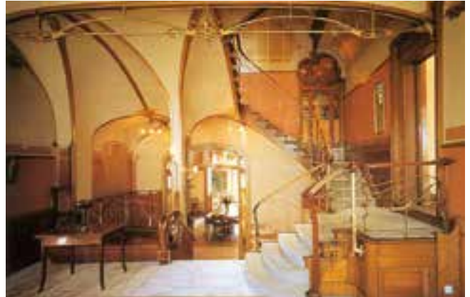
➤ Interieur Hortamuseum