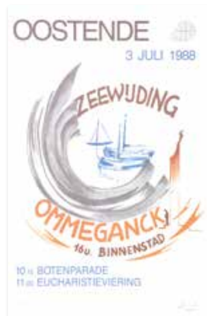
Maurice Boel, 1988