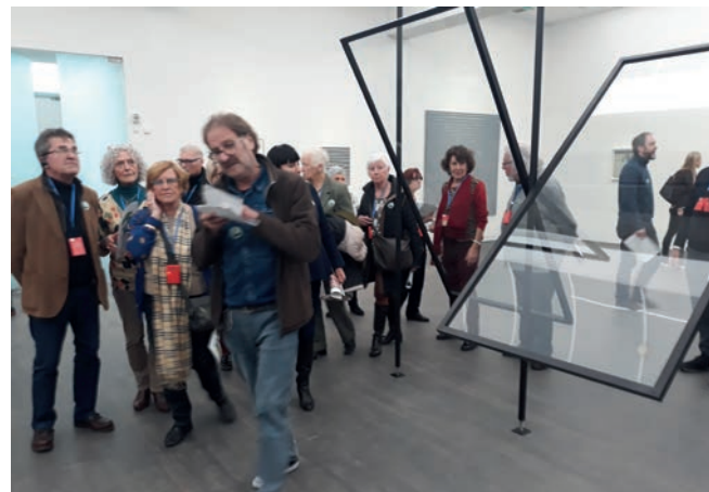
Met onze gids door de expo Gerhard Richter in het SMAK