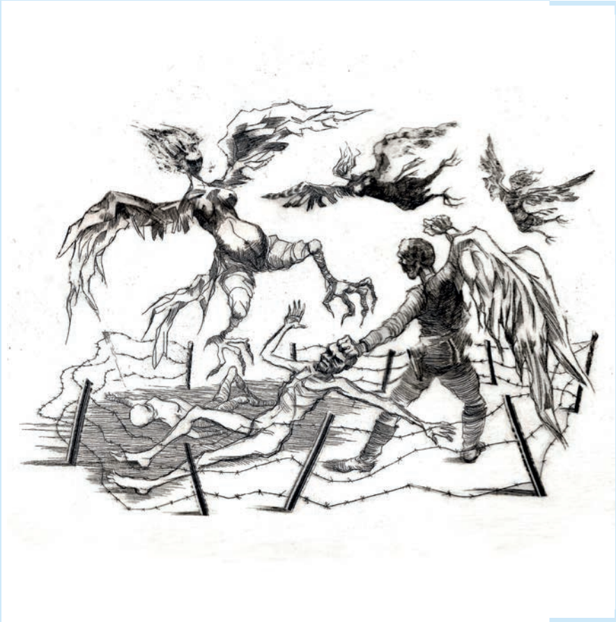
↳ Raoul Servais, 'The Angels of Death', ets, 2009 © Raoul Servais

jaargang 19 | Driemaandelijks tijdschrift | april - mei - juni 2018 Identificatienummer: P006345