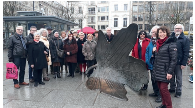
De Vrienden bij een van de kunstzinnige bladeren op de Kouter