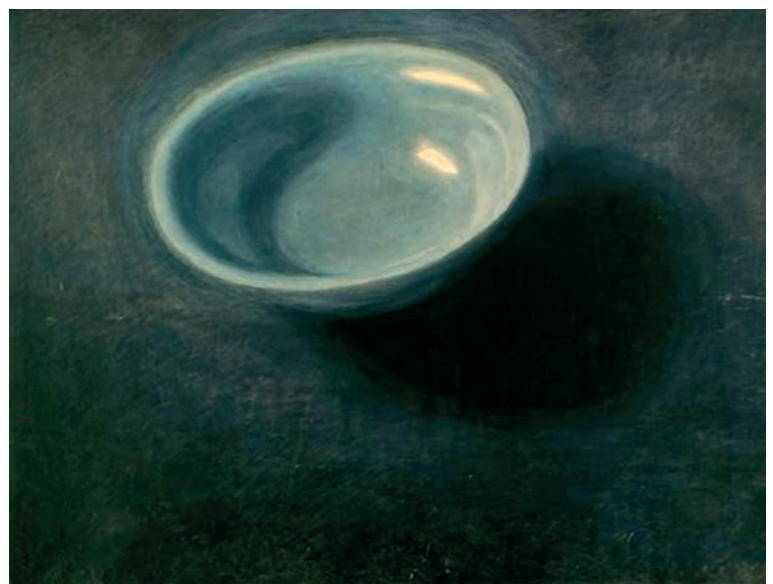
Léon Spilliaert, 'De Blauwe Teil', 1907