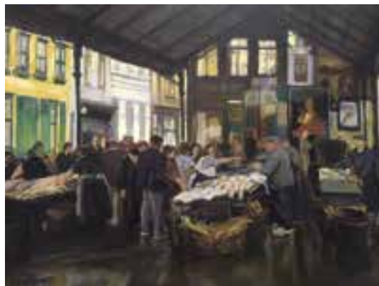
➤ Julius Collen Turner, 'Vismarkt te Oostende' (1939)

De tentoonstelling focust voornamelijk op zijn Oostendse periode (1936-1940 en 1945-1948): stadstaferelen, haven-