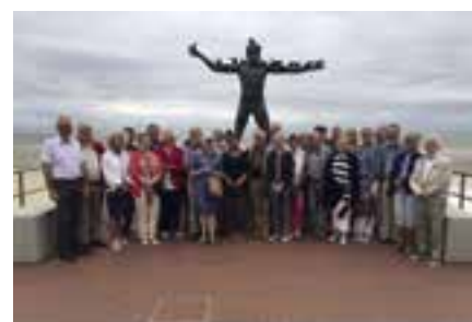
Op 23 augustus in De Haan bij 'Eternity - Poseidon' van Xu Zhen