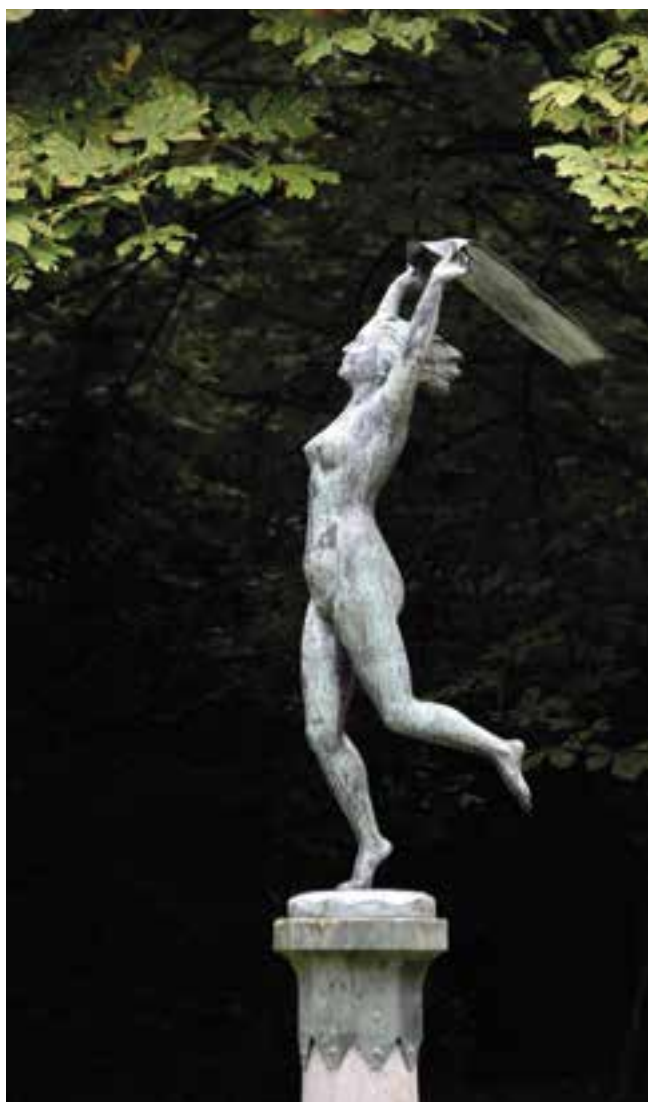
Emile Bulcke, 'De Wind', 1933, © Valère Prinzie

Het Leopoldpark dat in 1870 voltooid werd, ontworpen door tuinarchitect Louis Fuchs naar het model van een Engels park, heeft het nochtans allemaal: zijn unieke ligging in volle centrum, zijn niet te maniëristisch concept, de talloze hoeken en kanten, hoogtes en laagtes, nat en droog, die alle een andere uitstraling manifesteren. Je vindt er zowel een stuk van onze oude stadsmuur als de vier mythologische koppen van Leo Coppers die in de vijver op niet mis te verstane wijze symbolisch het water tot aan de lippen hebben. Het maakt