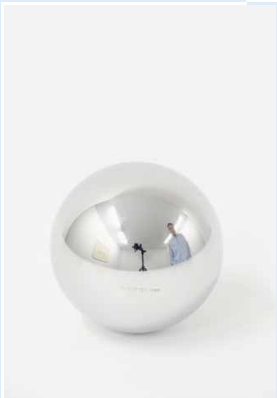
↳ Gerhard Richter, Kugel (Steel ball), staal, 1989 © stad Oostende foto: Steven Decroos

jaargang 19 | Driemaandelijks tijdschrift | oktober - november - december 2018 Identificatienummer: P006345