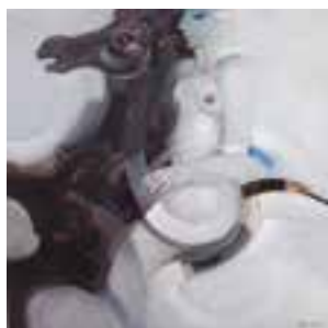
➤ Willy Bosschem, 'Bruine Hengst' (1994), 130 x 130