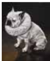
➤ Jef Seynaeve, 'The Special Dog'