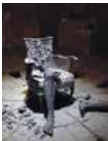
Object uit het kunstatelier in Keramis