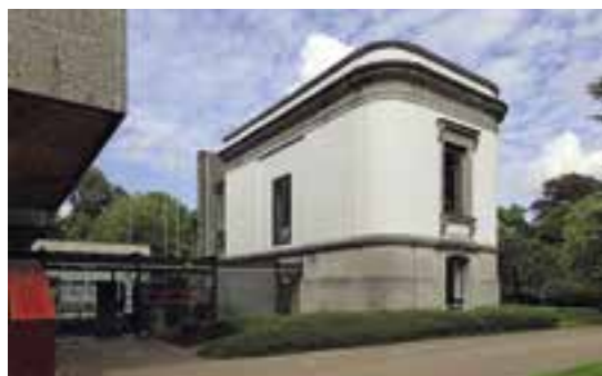
Museum van Mariemont: ingang