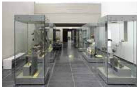
Museum van Mariemont: de afdeling Verre Oosten

Prijs: € 70 p.p., over te schrijven op rekening BE16 0012 0908 3374, ten laatste op 1 oktober 2018 met vermelding van keuze van voor- en hoofdgerecht