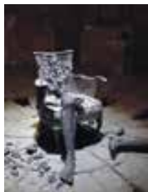
Object uit het kunstatelier in Keramis