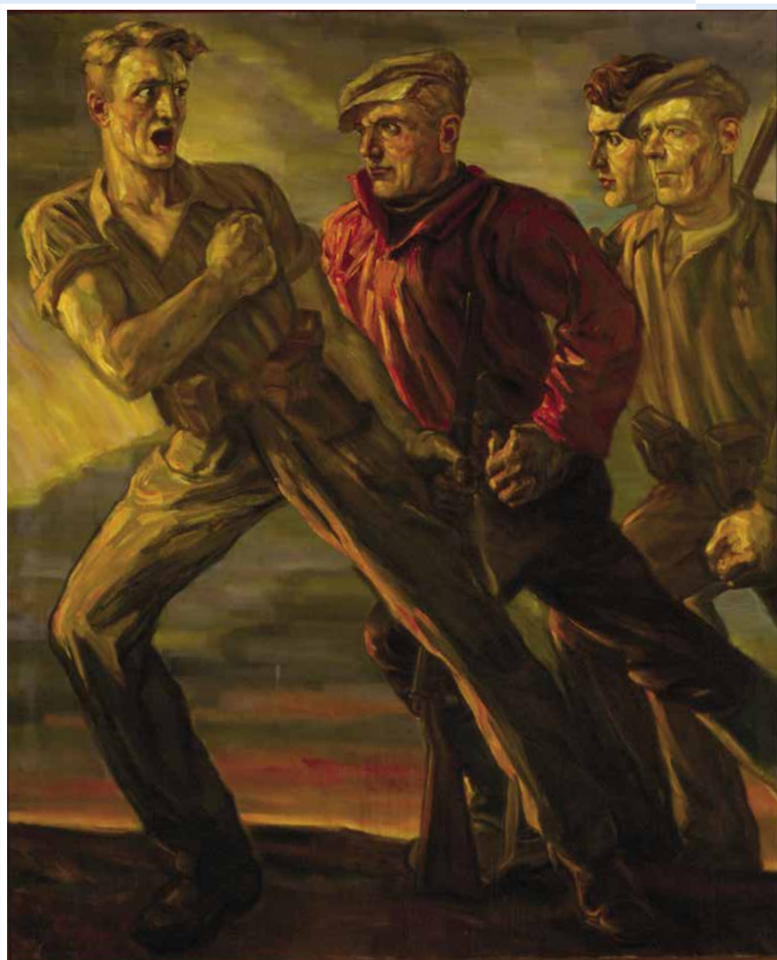
Julius Collen Turner, Hulde aan de Stad Oostende, olieverf op doek, 180 x 150 cm, 1946, inv. 1946/SM000900

jaargang 20 | Driemaandelijks tijdschrift | januari - februari - maart 2019