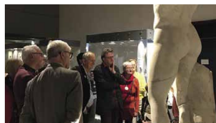
Rondleiding in het museum van Mariemont