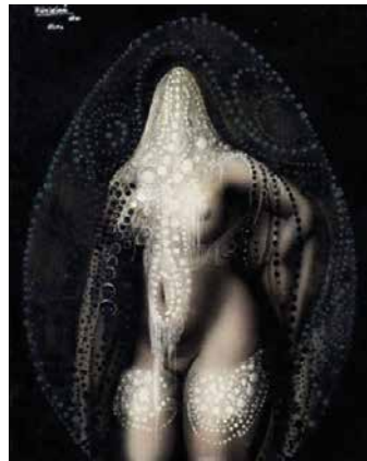
Modesto Roldán, Desnudo femenino (1980)

Het werk 'Aphrodite' heb ik jammer genoeg nog nooit in het echt gezien. Het staat in het depot van Mu.ZEE. Als ik een rendez-vous vraag, wil het museum het schilderij met plezier uit het depot halen. Ik ga dat zeker en vast doen.