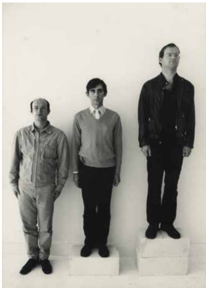
➤ Guy Mees, Portretten (Niveauverschillen) , 1970

De geselecteerde werken variëren van vroege werken met kant uit de jaren 1960 met de generische titel Verloren ruimte , tot de laatste werken op papier uit 2003. De selectie omvat de films en foto's uit de reeks Portretten (Niveauverschillen) , nooit eerder getoonde structuralistische werken uit de jaren 1970, reeksen pastel op papier uit het midden van de jaren 1970, en uit papier geknipte figuren uit de jaren 1980. Samen bieden ze een beeld van Mees' kunstpraktijk en zien we hoe hij zich kon onttrekken aan de eenzijdige effecten van estheticisme door een methode te hanteren, verankerd in variatie en gevoel.