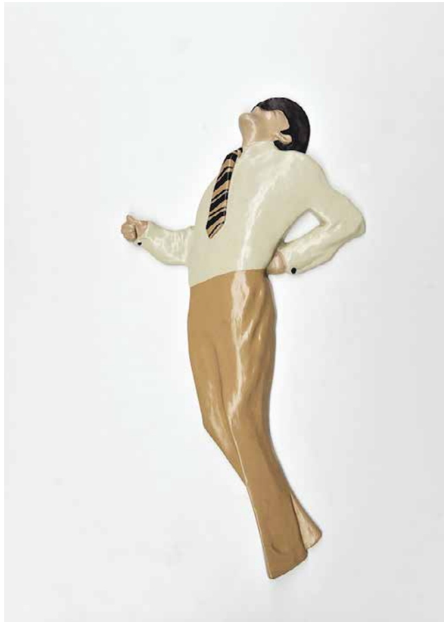
↳ Robert Longo, The American Soldier, 1975-1977