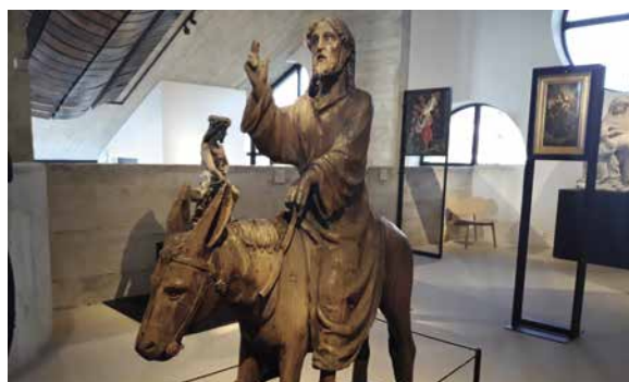
↳ Afdeling religieuze kunst in Musée L