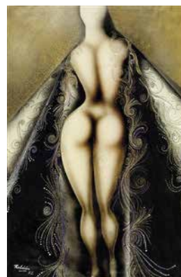
Modesto Roldán, Senza titolo (1972)

Centraal in het werk van Modesto Roldán staat de vrouw. De naakte vrouw is zijn belangrijkste leidraad, zijn muze, een godin die in de schilderijen en collages een sensueel en mystiek motief vormt. In verschillende werken beeldt Roldán de vrouw uit in aanwezigheid van mythische faunen. Zijn vriend, schrijver en journalist Francisco Umbral, omschreef het werk als ‘verlichte erotiek’.