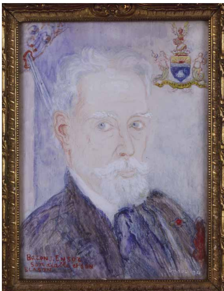
James Ensor, Zelfportret, Baron James Ensor, zijn duivel, zijn wapenschild INV. 1999/2.207, olieverf en potlood op paneel; 21,5 x 16 cm (ingekaderd; 80 x 76 x 6 cm), 1934, © Foto: Danny de Kievith