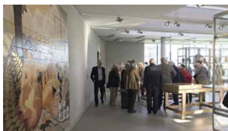
Rondleiding in Keramis, La Louvière