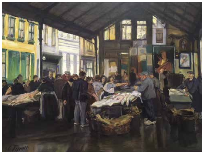
Julius Collen Turner, 'Vismarkt te Oostende' (1939)

De tentoonstelling focust voornamelijk op zijn Oostendse periode (1936-1940 en 1945-1948): stadstaferelen, havenzichten, portretten, werken die hij maakte voor de Vakschool, een allegorie op de bevrijding van Oostende... Een unieke kans om een bijzondere kunstenaar te herontdekken.