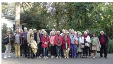
De Vrienden in het park van Mariemont

kennismaking met de hoogtepunten uit de collectie Egyptische en Oudgriekse kunst was er nog tijd voor een wandeling door het park of een bezoek aan andere afdelingen in het museum. Uiterst tevreden over deze kunstzinnige dag waren de Vrienden rond 19 uur terug in Oostende. (FS)