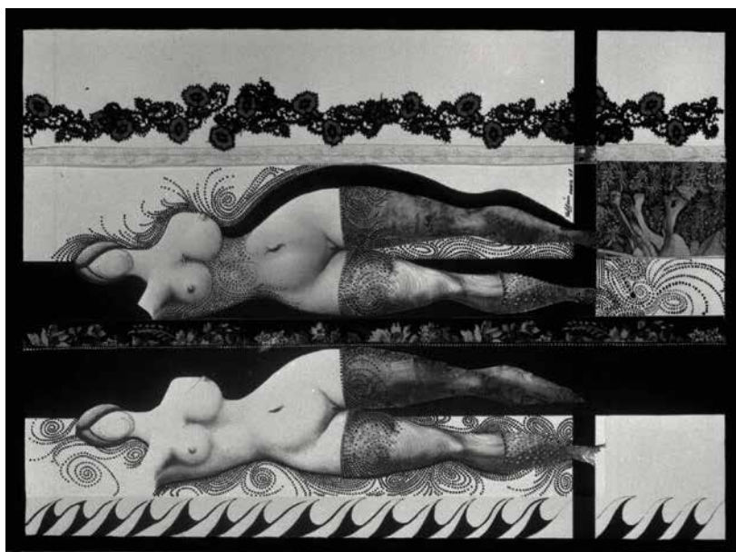
Modesto Roldán, Aphrodite (1967), gehoopte lithografie en collage op papier, 65 x 45 cm. Het kunstwerk bevindt zich in het depot van Mu.ZEE.

Meer dan van het schilderen is Roldán bekend van zijn collages. Vaak monteerde hij stukken kant op het schilderij of gebruikte hij ‘prikking’ van kant. Dat is het karton dat de basis vormt van een kantwerk. De gevoeligheid voor kant en stoffen kreeg Roldán al mee als kind, doordat hij uren vertoefde in het naaiatelier van zijn moeder. Dat kantwerk duikt ook op bij ‘Aphrodite’, het werk van Modesto Roldán dat Mu.ZEE bezit. Aphrodite is een litho en collage op papier. Op het werk zie je een liggend naakt en haar weerspiegeling in het water. De golven onderaan suggereren het water. Het werk is deels gemaroufleerd met zwart kantwerk. De combinatie van de litho en kant zorgt voor een sensueel gevoel en karakter. Hij doet hier een suggestie naar een pikante kousenband.