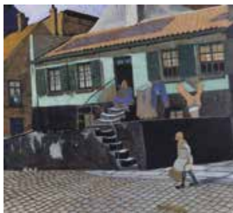
↳ Léon Spilliaert, De preekstoel, 1913, privéverzameling

Met een indringende blik observeerde hij, als gedreven kunstenaar, in talrijke versies, deze plaatsen waar bedrijvigheid en industrie wemelden: in de vissershaven, op de handelskaaien, rond het maritiem station en de vuurtoren, in de achtertuinen en boomgaarden, maar ook in de kleine bedrijven, nu meestal teloorgegaan. Met een zeer originele en persoonlijke toets verbeeldde hij de veranderingen van atmosfeer en de urbanistische ontwikkeling. Met de jaren evolueerden zijn composities, nu eens onderhevig aan een meer expressieve of geconstrueerde stijl, dan weer doordrongen van fantasie en surrealistische stemming.