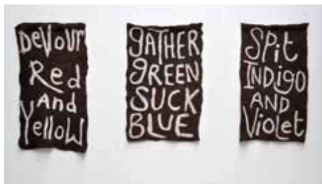
Orla Barry, 'Shearling Felts', 2011, zwartbles wool.