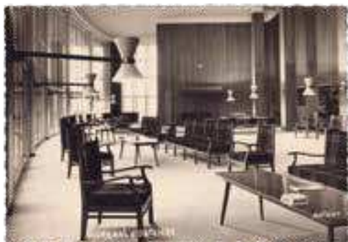
↳ De leeszaal van het kursaal