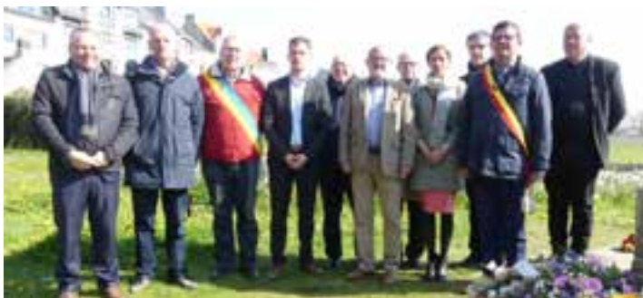
Vertegenwoordigers van het stadsbestuur, de provincieraad en diverse cultuurverenigingen