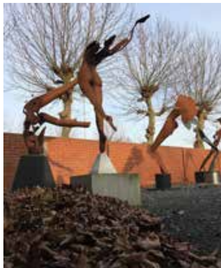
↳ Tweede beeld rechts: 'Wilskracht'