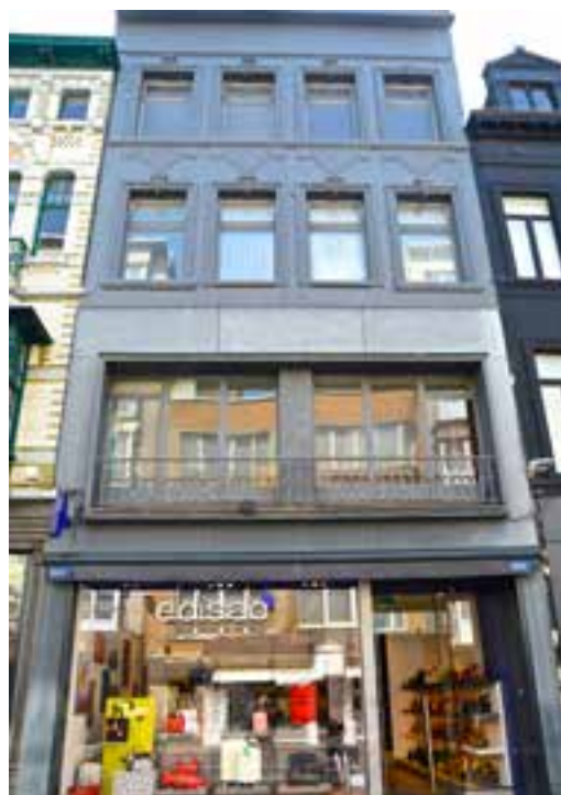
↳ Beneden bevond zich de couture- en lingeriewinkel, boven Galerie Studio