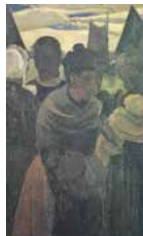
👉 Constant Permeke, 'Vissersvrouwen op de kaai', 1913, olie op doek, 116 cm x 76 cm

bijzondere aandacht gezien hun materiële toestand. Meestal zijn ze zeer pasteus opgebouwd en geschilderd op een te flexibele industriële ondergrond. Deze ondergrond werd geprepareerd met calciumcarbonaat, loodwit en lijnolie op een vooraf gelijkde drager. Deze dragers zijn zeer gevoelig voor schommelingen in temperatuur en vochtigheid.