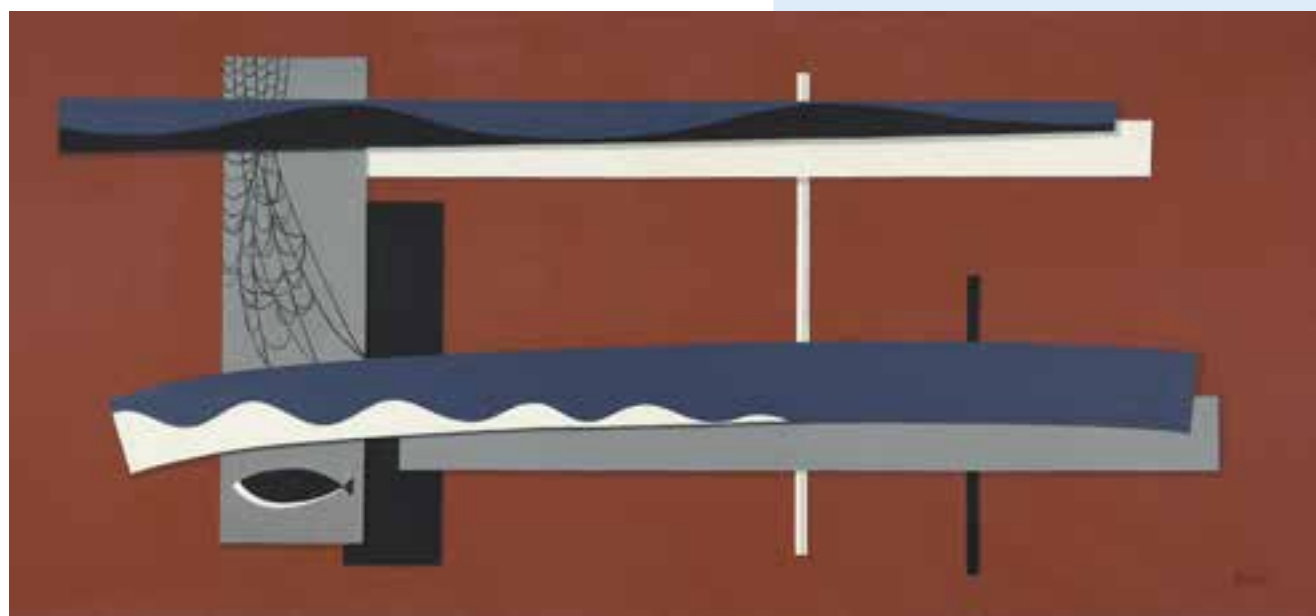
👉 Maurice Boel, expo 1958

jaargang 20 | Driemaandelijks tijdschrift | juli - augustus - september 2019