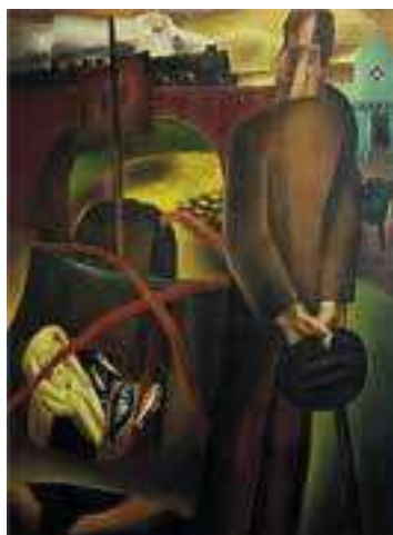
👉 Frits Van Den Berghe, 'De Eeuwige Zwerver / Vagebond', 1925, olie op doek, 160 cm x 120 cm

Constant Permeke wordt gezien als belangrijkste vertegenwoordiger van het Vlaamse expressionisme. Hij werd het meest bekend om zijn sterke en plechtige afbeeldingen van zeelieden, werkende personen en vissers met hun vrouwen, waarvan hier een duidelijk voorbeeld. Net als zijn andere werken werd het schilderij stevig in de verf gezet in zijn gekende okers en ombers. Tinten en kleuren wisselen elkaar af. Deze werken vereisen een