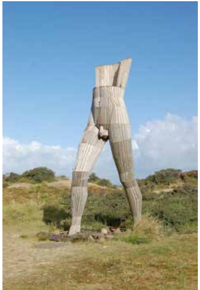
📍 Gerhard Lentinck, 'Christophorus', hout en staal, 690 x 300 x 421 cm

In onze tijd doet het beeld aan de rand van de Noordzee automatisch denken aan de transmigranten die de overtocht naar Engeland willen maken. Migratie is een inspiratiebron voor heel wat hedendaagse kunstenaars.