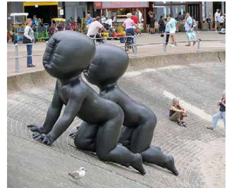
» Baby's in Middelkerke, 2006