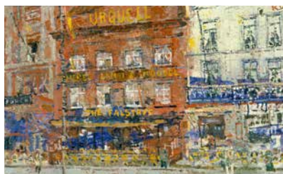
J. J. Gailliard, 'De Fallstaff', Salon Moderne Kunst