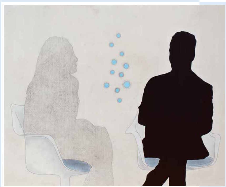
Yves Velter, 'The stage Act V', 2019, 100 x 80cm, acryl/chinese inkt/pigment/potlood/spiegels op canvas

jaargang 21 | Driemaandelijks tijdschrift | juli - augustus - september 2020 Identificatienummer: P006345