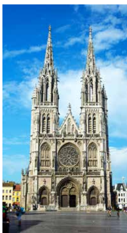
Sint-Petrus en Pauluskerk

Maar ook tijdens de vakantiemaanden is er een cultureel aanbod. U kunt de musea in Oostende bezoeken door vooraf in te schrijven. U krijgt als lid gratis toegang tot Mu.ZEE als u inschrijft