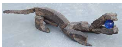
» Pierre Claes, 'Kracht uit de stilte van Kracht'

Ooit begonnen bij een duinenwandeling met vrienden in de Westhoek, waar na een storm een ganse duinvlakte zand was weggewaaid en alles bruin zag van stukjes geroest metaal. Grillig van vorm, gepolijst door wind en zand, gewoon te mooi om te laten liggen. Het bleken stukken schrapnel te zijn uit de Eerste Wereldoorlog. Ooit krachtige projectielen die dood en vernieling zaaiden, maar gedurende de jaren dat ze geduldig in het zand van de duinen gewacht hadden, waren ze tot rust gekomen.