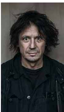
» David Cerny