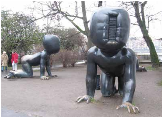
» Baby's van David Cerny, Praag

Lieve Malfroot heeft de Vrienden tijdens de triënnale Beaufort in 2018 tweemaal begeleid als gids, eerst langs de westkust (op 31 mei) en later langs de oostkust (op 23 augustus). Dat bracht de redactie op het idee om haar, met haar expertise, te vragen om de kunstwerken die sinds 2003 na elke Beauforteditie aan de kust zijn blijven staan, in Pro Luce te bespreken. In de zesde bijdrage aan de rubriek 'Beaufort: de blijvers' viel haar keuze op 'Baby's' van de Tsjech David Cerny uit de tweede editie van Beaufort, in 2006.