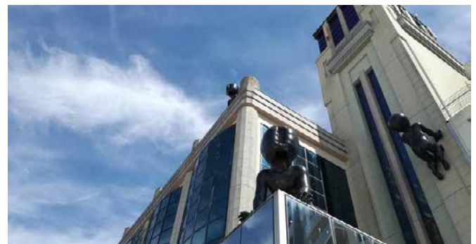
» Casino Blankenberge: drie Baby's

Na Beaufort 2006 werden de drie baby's aangekocht door de stad Blankenberge. Sinds maart 2007 sieren ze de gevel van het casino op de zeedijk 150.