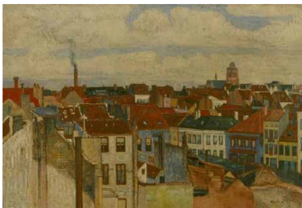
» James Ensor, 'De daken van Oostende', 1906