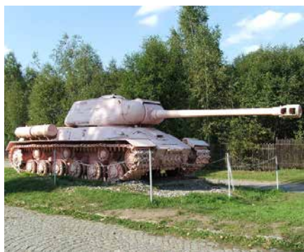
» Roze Russische tank, Lasany