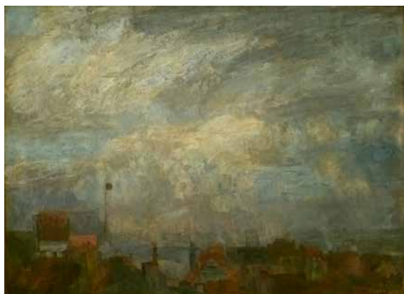
» James Ensor, 'De daken van Oostende', 1884