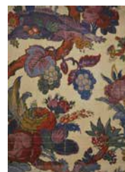
Servranckx, 'Proof for U.P.L. wallpaper'