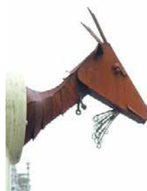
» 'Chèvre', geitenkop uit recuperatie-ijzer

Misschien toch nog een klein pijnpuntje. Het pleintje, zoals het er nu staat, is toch niet helemaal lovend voor wat ooit dé kunstkring van Oostende was. De geit verloor reeds tweemaal zijn horens aan de straataffiches.