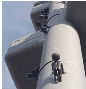
» Baby's, tv-mast, Zizkov-Praag