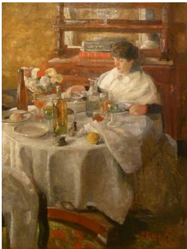
James Ensor, 'De oestereetster', 1882