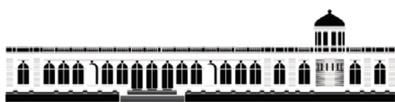
Venetiaanse Gaanderijen-Zeedijk Oostende

Bankrelatie Vrienden Mu.ZEE p.a. Albatrosstraat 10, 8400 Oostende IBAN: BE16 0012 0908 3374, BIC: GEBABEBB