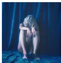
↳ Lili Dujourie, 'In mijn nacht nadert niemand', 1985

Ook kunstenaars als Jan Vercruyse, Lili Dujourie, Luc Tuymans en Cris Brodahl gebruiken de stilte als methode om te getuigen over het onnoembare. De stilte bij Jan Vercruyse is als een denkbeeldig huis waar enkel kunst kan gedijen en reflecteren over zijn eigen bestaan. Bij Lili Dujourie vertelt de stilte over de fragiele positie van de kunstenares en Luc Tuymans gebruikt de poëzie van de stilte om de onzekerheid van ons geheugen en de geschiedenis te bevragen. Cris Brodahl hanteert de stilte dan weer om de ijzige koelte waarmee de mens naar zichzelf kijkt, te bezweren. Niets is veelzeggender dan de stilte.