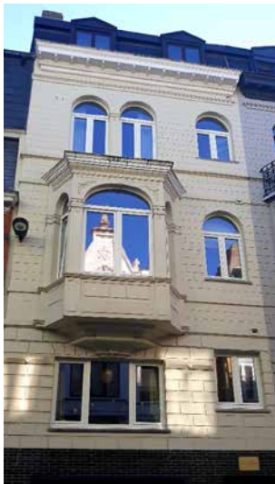
Peter Benoitstraat 13, Oostende