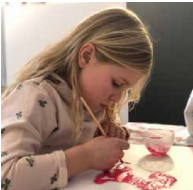
Ada aan het werk