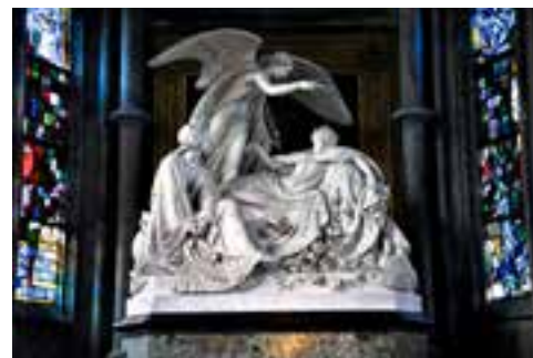
» Praaigrav in de Sint-Petrus- en Pauluskerk

Op 11 oktober 1850 overlijdt ze in de voorkamer op de eerste verdieping van de Langestraat, vermoedelijk aan tuberculose. Ze was amper 38 jaar oud. Volgens haar wens werd ze niet begraven in Oostende, maar werd haar lichaam per trein overgebracht naar Brussel. Daar werd ze bijgezet in de crypte van de kerk van Laken, die vanaf dan de officiële begraafplaats zal worden van de Belgische koninklijke familie.