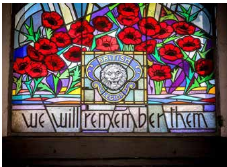
👉 Poppies in de Engelse kerk

Het interieur is sober, gecementeerd en wit beschilderd, met spitsbogen en een aangepaste zoldering. Het Hooghuysorgel is een van de oudste van Oostende en werd nog door James Ensor bespeeld. Het orgel is inmiddels overgedragen aan de Sint-Therisiakerk in Bredene. In de kerk valt het ontbreken van heiligenbeelden op: dit is typisch voor alle protestantse kerken. Een reeks vlaggen, gedenkplaten en poppies of papavers brengen de Eerste Wereldoorlog in herinnering.