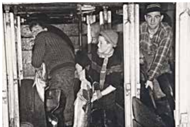
➤ Stapelen in het ruim. Na het gutten van de vis, werd de vangst kop aan staart ondergebracht in het visruim, mooi gesorteerd op lagen ijs.