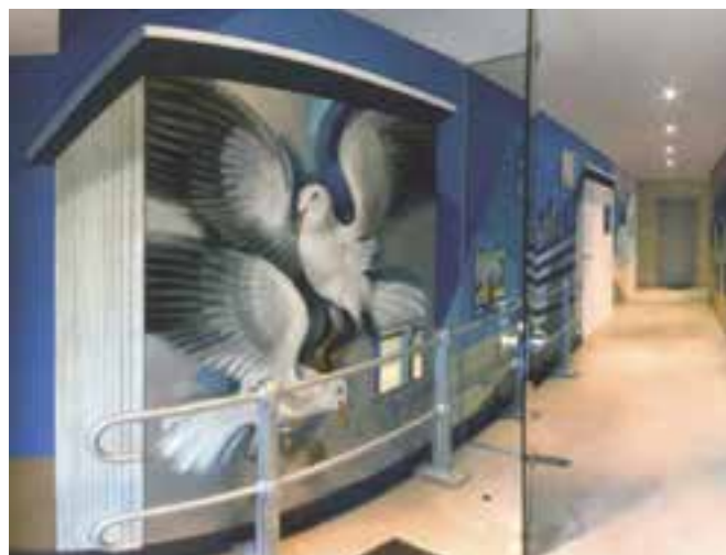
Willy Bosschem, muurschildering, Torhoutsesteenweg 11, 2011

Als beeldend kunstenaar ontpopte hij zich als kunstschilder, etser, tekenaar, graficus, ontwerper van affiches, postzegels, logo's, theater- en televisiedecors, zelfs wandtapijten en monumentale muurdecoraties.