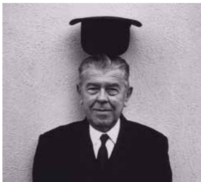
➤ René Magritte