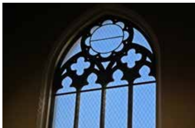
↳ Raampartij Anglicaanse kerk

Bankrelatie Vrienden Mu.ZEE p.a. Albatrosstraat 10, 8400 Oostende IBAN: BE16 0012 0908 3374, BIC: GEBABEBB Ondernemingsnummer: 0443073531