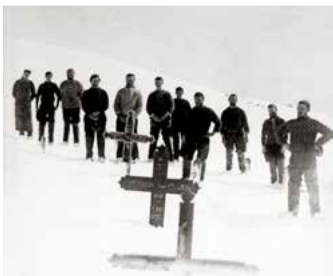
➤ Begraafplaats Faskrudsfjord, 1908. De menselijke en materiële verliezen op de IJslandvaart waren aanzienlijk: afhankelijk van de weersomstandigheden vergingen elk jaar minstens vijf vaartuigen en keerden tientallen vissers na de zomer niet naar huis terug. In de baai Faskrudsfjord hadden de Fransen een eigen ziekenhuis, kapel en kerkhof. Op de begraafplaats liggen ook Vlaamse vissers begraven.

De IJslandvaart werd vanaf de zeventiende eeuw uitgevoerd met traditionele zeilvissloepen, vanuit Noord-Frankrijk. Aange trokken door grote voorschotten, avances, monsterden ook Vlaamse vissers aan in Duinkerke en Gravelines. Zo waagden honderden vissers elk jaar hun leven voor de jacht op de gegeerde kabeljauw in de ijskoude wateren rond IJsland. De kabeljauwcampagne besloeg zes maanden. De vissers deden er gemiddeld twee weken tot soms een maand over om IJsland te bereiken. Door de opkomst van de stoomschepen en het gebruik van ijs als bewaarmiddel voor de vangst aan boord verplaatste het zwaartepunt van de kabeljauwcampagne zich naar Oostende. De oversteek duurde nog maar vier dagen en er werd het jaar rond op IJsland gevaren. Deze grotere campagnes naar IJsland waren van grote betekenis voor Oostende-vissersstad. In de jaren 1970, amper vijftig jaar geleden, kwam er aan dit vissersavontuur een einde. De O.129 Amandine staat symbool voor de Europese IJslandvaart en werd in 1995 als laatste Oostends schip uit de vaart genomen. Hiermee viel definitief een doek over de IJslandvisserij.