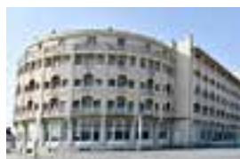
➤ Grand Hotel Belle Vue