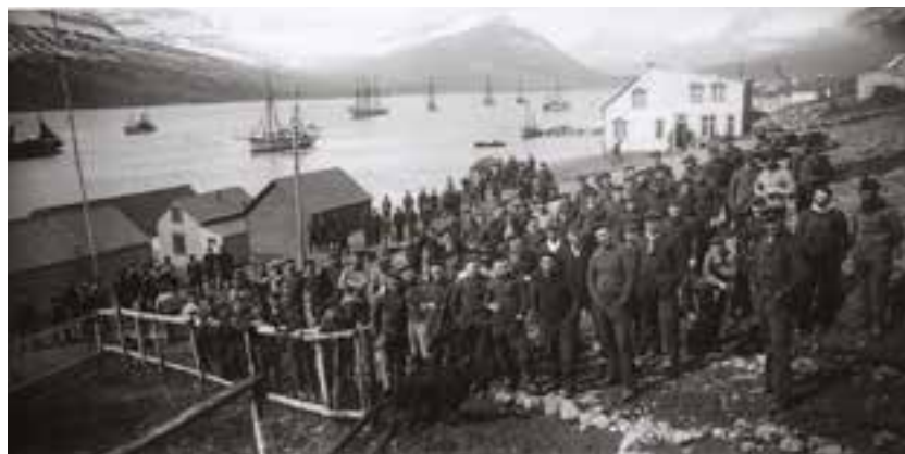
➤ Faskrudsfjord, collectie Navigo, 'IJslandvissers in de Faskrudsfjord', 1908

In de Venetiaanse Gaanderijen kunt u van 26 juni tot en met 7 november 2021 de erfgoedtentoonstelling over de IJslandvisserij bezoeken. Het is een tak van de visserijgeschiedenis die zeer tot de verbeelding spreekt omwille van het heroïsche aspect, de gevaarlijke en avontuurlijke lokroep van de zee en de bittere noodzaak om te overleven. 'Onze IJslandvissers' legt het erfgoed en de ziel van onze visserscultuur in Oostende vast en brengt met een diep respect een ode aan de vissers die er nog zijn en voor de velen die er zijn geweest.