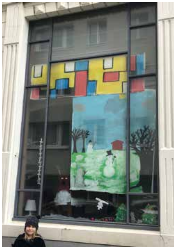
Ada voor het raam met de tentoonstelling