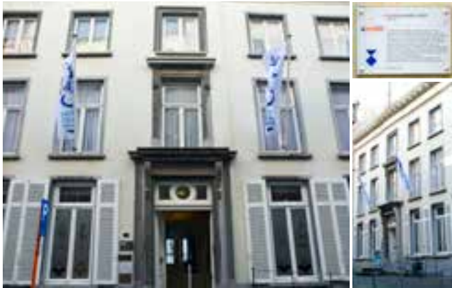
» 'Huize Louise-Marie', Langestraat 69

In het Stadsmuseum, Langestraat 69, loopt nog tot eind augustus 2021 de tentoonstelling 'Oostende en het koningshuis'. Het pand, een herenhuis uit 1780, werd in 1834 als koninklijke residentie ter beschikking gesteld van de eerste Belgische koning en koningin, Leopold I en zijn vrouw Louise-Marie d'Orléans. Het gebouw, met een gelijkvloers en twee verdiepingen, bezit helemaal boven een belvédère, met toen nog uitzicht op de haven en de zee.