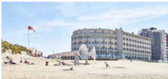
➤ Ivars Drulle, 'I can hear it', Beaufort 2012

De kleding van de vrouw verwijst naar de Art Nouveau-stijl en de Belle époque, de tijd dat het Grand Hotel Belle Vue gebouwd werd van 1909 tot 1911. Na het Westend Hotel in het centrum werd een tweede zeedijkhotel gebouwd. De architect was Octave Van Rysselberghe (broer van Theo). Het was een vooruitstrevende constructie waarbij een skelet van beton werd bekleed met natuurstenen platen. Het is dankzij deze constructie dat het de verwoesting van WO I doorstaan heeft. Het hotel omvatte 120 kamers, 2 liften, 16 baden met warm water en een dakterras.