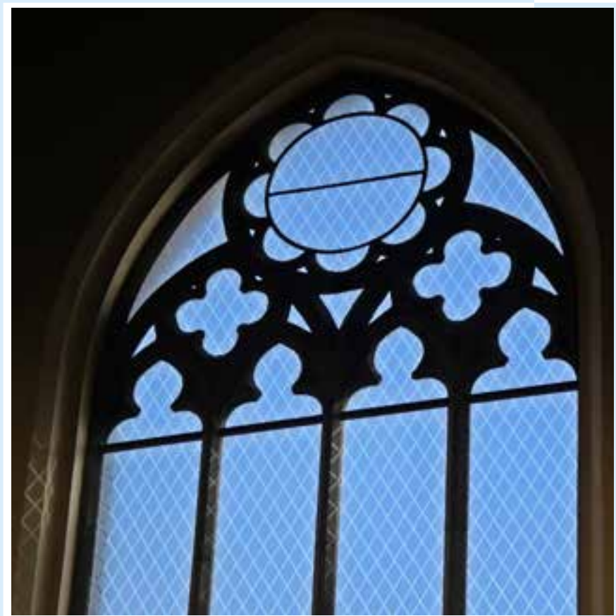
↳ Raampartij Anglicaanse kerk, © Natalie Luys

jaargang 22 | Driemaandelijks tijdschrift | april - mei - juni 2021