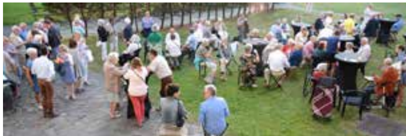
» Garden Party, juli 2019