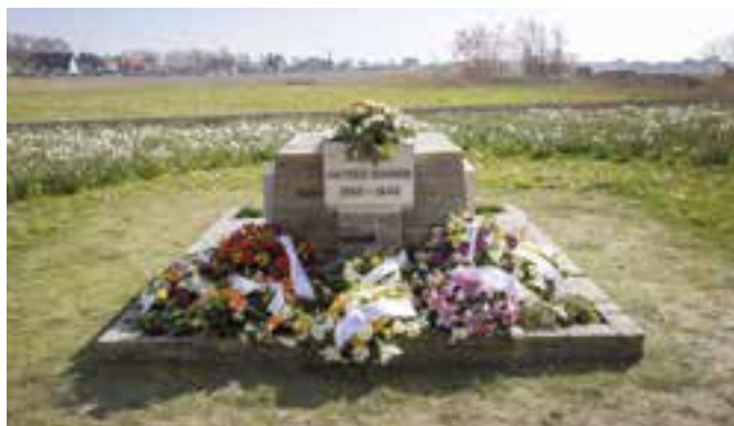
➤ Graf James Ensor

Op 20 november 2021 om 15.00 uur herdenkt de Stad zijn beroemdste inwoner, baron James Ensor met een concert in de kerk O.L.V.-Ter Duinen , Dorpsstraat Mariakerke/Oostende.