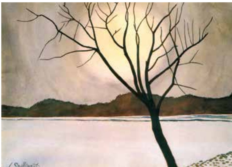
↳ Léon Spilliaert, 'Winterlandschap', 1929