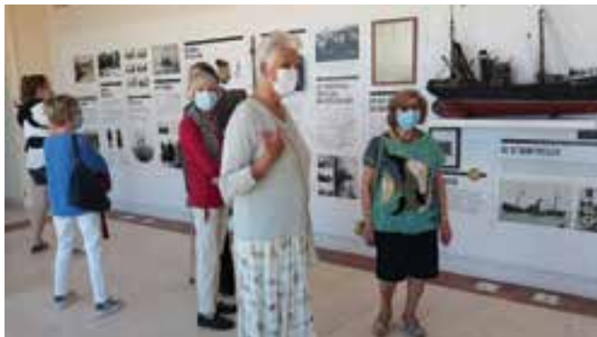
➤ Introductie tot de expo 'Onze IJslandvisserij'

–verwerking, de contacten op IJsland, het geloof en bijgeloof, de terugkeer in Oostende, en de herinneringen aan heroïsche momenten. De markante vissersfoto's van Stephan Vanfleteren in de ronde zaal maken het plaatje compleet. (FS)