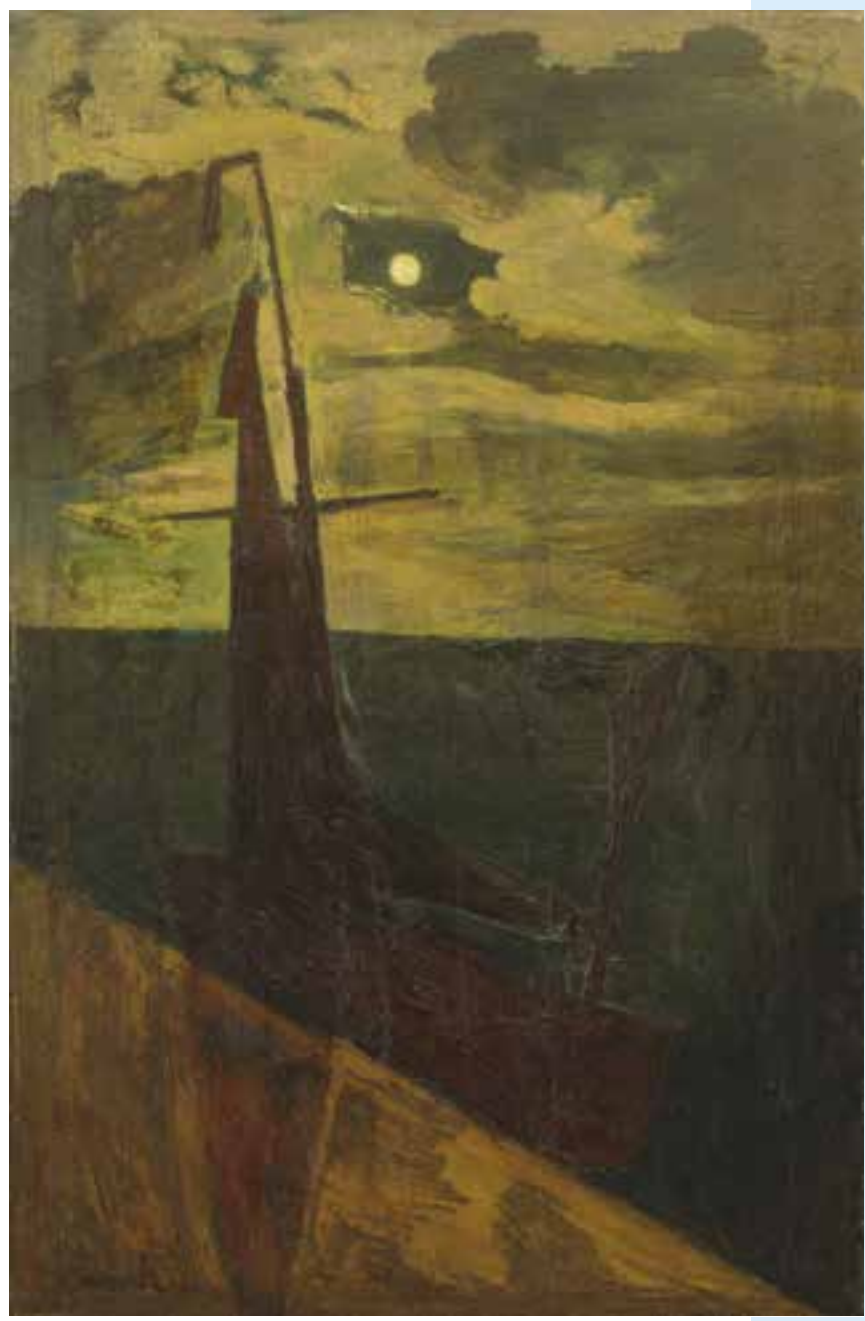
Constant Permeke, 'Maneschijn'

jaargang 22 | Driemaandelijks tijdschrift | oktober - november - december 2021 Identificatienummer: P006345