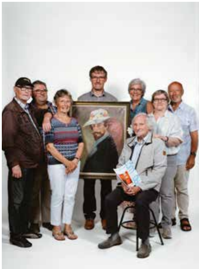
↳ delegatie van de Vrienden van Mu.ZEE © Stad Oostende

Met de Maand van de Vrije Tijd zet de Stad in september het rijke Oostendse verenigingsleven in de kijker waarbij Oostendenaars kunnen proeven van vrije tijd in al zijn vormen. Ook de Vrienden Mu.ZEE nemen deel aan dit initiatief!