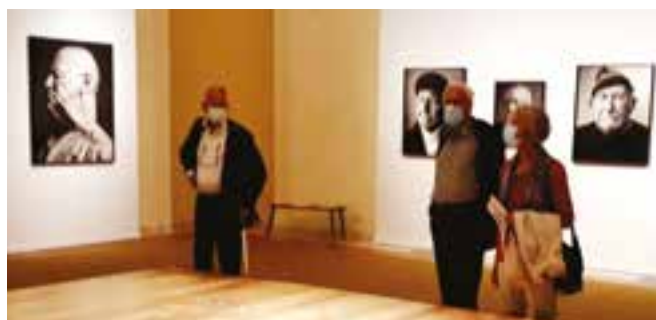
➤ Markante vissersportretten van Stephan Vanfleteren

De tentoonstelling is opgebouwd rond diverse thema's uit de IJslandvaart. Interessant is dat bij elk thema zes voormalige IJslandvisserij zelf aan het woord komen, in interviews afgenomen door journalist Martin Heylen. In combinatie met de diverse foto's en objecten krijgt de bezoeker door deze persoonlijke verhalen een goed beeld van wat de toch wel gevaarlijke en avontuurlijke IJslandvaart inhield: van het leven aan boord, de visvangst en