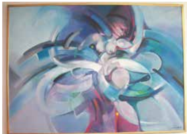
↳ Willy Bosschem, 'Dansende vrouw', 1985

In 2020 is de immer actieve, dynamische kunstenaar trouwens 90 jaar geworden. Een dubbele reden dus om de toekenning van de Cultuurprijs 2020 te vieren! (FS)