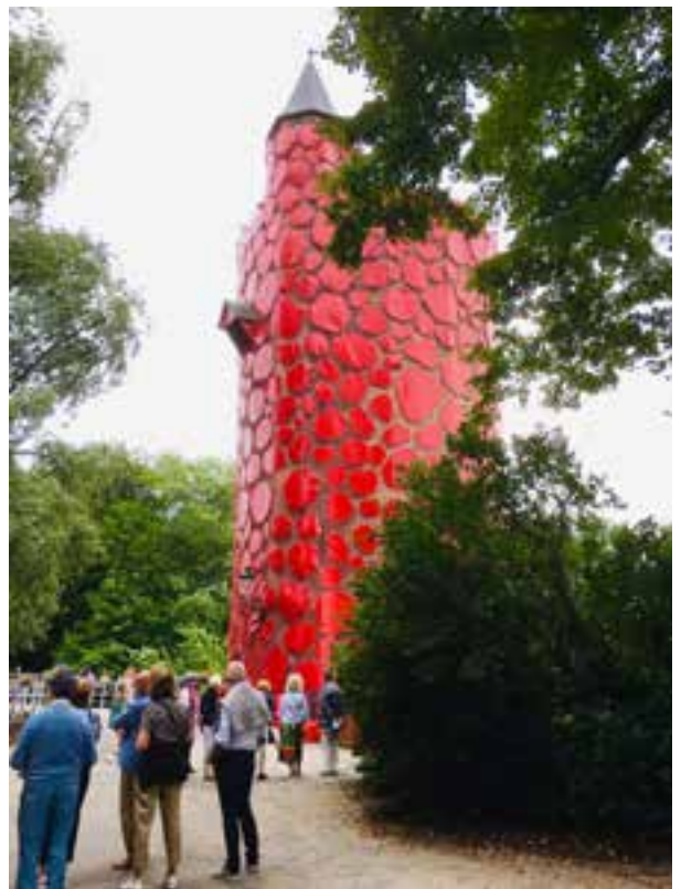
➤ Poertoren: 'And the World keeps Turning' van Nnenna Okore © Martine Vyvey

Door het mooie weer was het aangenaam wandelen door Brugge en tegelijkertijd genieten van de kunst onderweg. (FS)