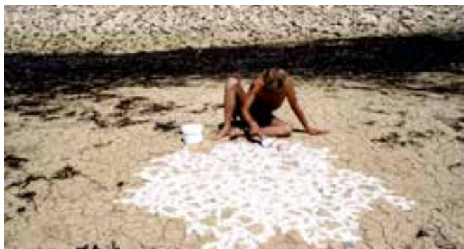
↳ Maarten Vanden Eynde La restauration de lac Montbel, 2003

In Digging up the future - Gravend naar de toekomst onderzoekt Maarten Vanden Eynde het verband tussen het economische groeimodel en de achteruitgang van onze aarde. De tentoonstelling presenteert zijn werk van 2000 tot 2020, een periode waarin veel technologische vooruitgang is geboekt, maar die ook gekenmerkt wordt door opeenvolgende crisissen. Internet, big 'technology' en social media wijzigden onze manier van leven, werken en denken op een radicale manier. Intussen is de wereldbevolking en bijgevolg de consumptie en het energieverbruik gestaag gegroeid, wat ons confronteert met de eindigheid van de grondstoffen, extreme weerfenomenen, de overvloed aan afval en het verlies van de biodiversiteit van de planeet. Digging up the future - Gravend naar de toekomst zet sterk in op de mediëring van het oeuvre van de kunstenaar. In de vorm van een audiogids zullen thema's als natuurwetenschappen, ecologische en sociale rechten in een globale en postkoloniale context aan bod komen, ingesproken door experts uit verschillende domeinen. In 2022 reist de tentoonstelling naar La Kunsthalle Mulhouse in Frankrijk.