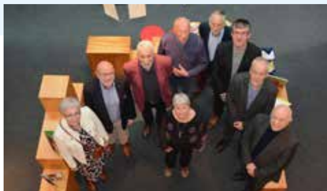
» Het bestuur van de Vrienden van Mu.ZEE in 2020