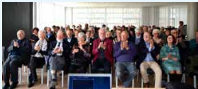
Algemene ledenvergadering 2020