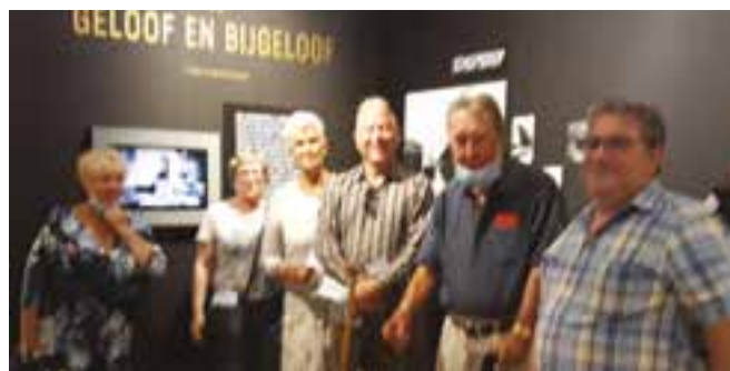
➤ Enkele Vrienden bij het thema 'Geloof en bijgeloof'

–verwerking, de contacten op IJsland, het geloof en bijgeloof, de terugkeer in Oostende, en de herinneringen aan heroïsche momenten. De markante vissersfoto's van Stephan Vanfleteren in de ronde zaal maken het plaatje compleet. (FS)