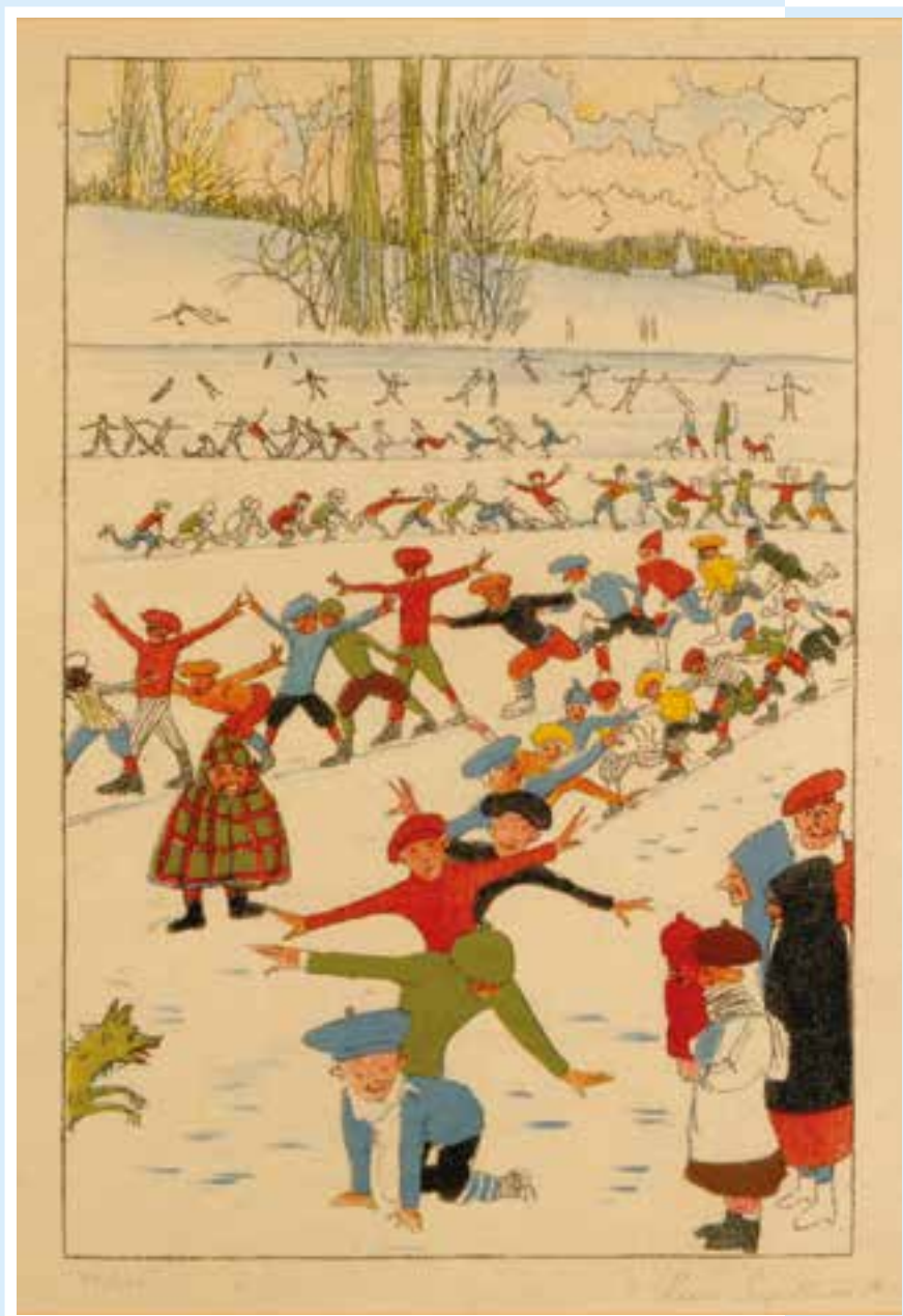
↳ Léon Spilliaert, Schaatsende kinderen, uit Plaisirs d'hiver, 1918, litho, 304 x 207 mm © Daniël De Kievith