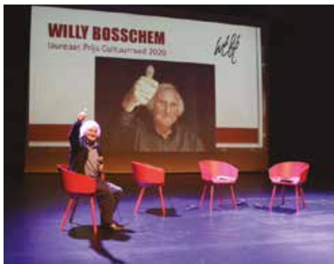
➤ Slot van de prijsuitreiking

Kortom, het was een heel gemoedelijke en gezellige avond, afgerond met een mooie receptie, waar iedereen met elkaar kon bijpraten na de lange periode van afzondering en lockdown. (FS)