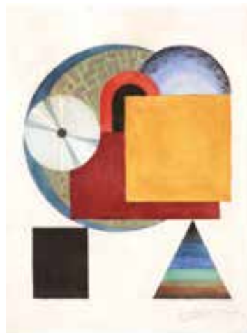
» Victor Delhez, 'Compositie met driehoek', ca. 1926

Er wordt ingezoomd op het kunstenaarsnetwerk van drie figuren die direct of indirect met elkaar in contact stonden. De Belgische-Argentijnse kunstenaar Julio Payro (1899-1971) die een levenslange vriendschap met Paul Delvaux uitbouwde, de Belgische kunstenaar Victor Delhez (1902-1985) die na de dood van zijn ouders uitweek naar Argentinië en de Argentijnse advocaat Ignacio Pirovano (1909-1980), vriend en verzamelaar van het werk van Georges Vantongerloo . Naast artistieke worden ook politieke en economische drijfveren belicht. Argentijnse kunst, die in Europa vooral onder de noemer 'Latijns-Amerikaanse kunst' viel, werd in België lange tijd genegeerd. Pas met de deelname van Argentinië aan Expo 58 in Brussel kwam hier verandering in.