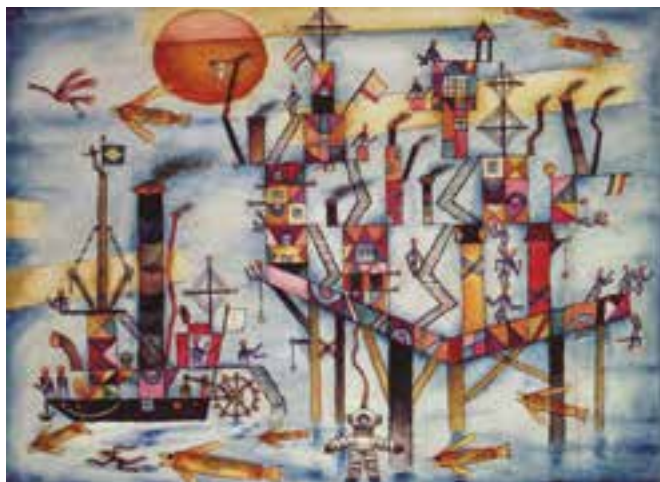
» Alejandro Xul Solar, 'Puerta Azul'

Meer dan men zou vermoeden! Dit verrassende verhaal wordt verteld in deze bijzondere tentoonstelling die de artistieke banden onderzoekt tussen België en Argentinië in de periode 1910 tot 1958. Deze artistieke banden laten zich niet vatten in klassieke kunsthistorische benaderingen die focussen op 'leven en werk' van kunstenaars. Het gaat over historische tentoonstellingen, literaire connecties en vaak minder bekende kunstenaars met hybride profielen die uit de canon werden geschreven of herleid tot een voetnoot.