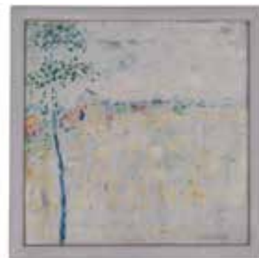
» Georges Vantongerloo, 'Mamba'

Tot slot: de stad Oostende krijgt een symbolische betekenis in dit project. In 1912 stichtten een Belg en een Italiaan 'Ostende, parel van de Atlantische kust', een zusterstad van de Belgische badplaats op 360 kilometer van de Argentijnse hoofdstad Buenos Aires. Hoewel het de ambitie was om honderden Belgische families naar Ostende te laten verhuizen – en met hen Belgische kunst en cultuur – is het project een anekdotische voetnoot gebleven in de geschiedenis van beide landen. De trans-Atlantische verhalen en netwerken hebben de weg naar de geschiedenisboeken nog maar amper gevonden. Mu.ZEE acht de tijd rijp om de kunstgeschiedenis mee te doen herbronnen en ziet het als zijn missie om dergelijk nieuw onderzoek ruimte te geven en een breed publiek kennis te laten maken met een andere, meer globale kunstgeschiedenis.