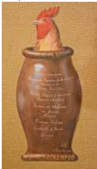
↳ Schilderij Emile Bulcke (collectie De Plate)

Aan de hand van eigen archieven van 'De Plate', aangevuld met privéverzamelingen, ondergaat de bezoeker de evolutie van geporseleinde menukaarten tot gerechten op computer: een boeiende ervaring, gespreid over twee eeuwen. De plaatselijke horeca, de hotelschool, de gastronomische weekends, de wedstrijd 'Prosper Montagné', de Oostendse oesters, gulden boeken, transport, plaatselijke verenigingen en zoveel meer komen aan bod.