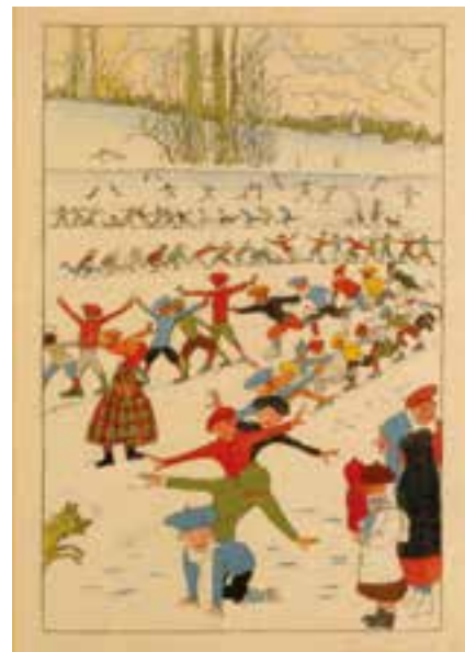
↳ Léon Spilliaert, Schaatsende kinderen, uit Plaisirs d'hiver, 1918, litho, 304 x 207 mm

iedere dag open van 9.00u tot 23.00u keuken open tot 23.00u Hendrik Serruyslaan 18 A 8400 Oostende Reservaties & info 0496 25 84 88 cultuurcafe@degrotestpost.be