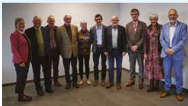
» Het bestuur van de Vrienden van Mu.ZEE in 2021