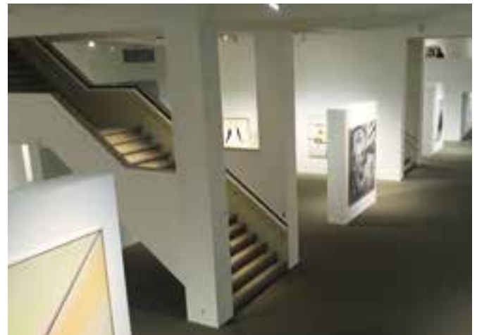
↳ Vernieuwde Mu.ZEE

En het succes volgde! Er kwamen lovende artikels – ook in de Nederlandse, Franse en Duitse pers. Mu.ZEE werd opnieuw een diepmenselijk museum met het zonnigste onthaal van het land. We willen elke bezoeker immers verwonderen en laten genieten en dat voelt men: van veertig bezoekers per dag evolueerden we tot topdagen met meer dan 600 bezoekers. Ook na de zomer, in Oostende toch het hoogseizoen, houden de bezoekersstromen gestaag aan.