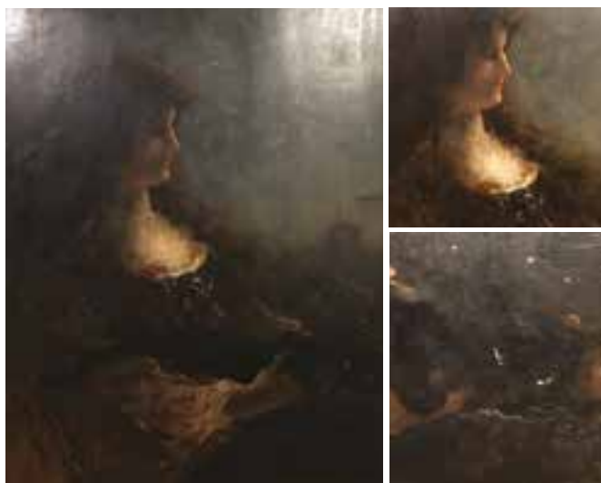
➤ Alfred Stevens, 'La nuit', met rechts twee details

Tijdens een van mijn bezoeken aan Mu.ZEE trok een wat mysterieus werk mijn aandacht. Een olieverfschilderij in donkere tinten, wat clair-obscur met een discrete lichtinval op het profiel van het gezicht en op de boezem. Het schilderij stelt een jonge dame voor met een weelderige haardos – de ogen neergeslagen naar de zwarte poes die rust in de hand op haar schoot.