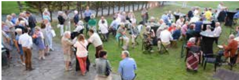
» Garden Party, juli 2019